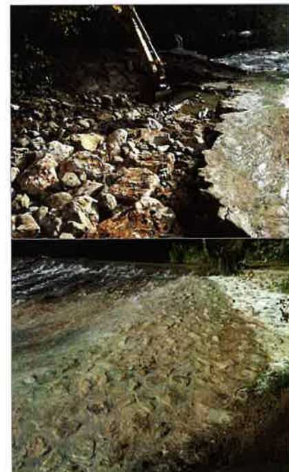
Rive gauche de l'écluse. En couverture du bulletin, vue de la fosse centrale avant et après.