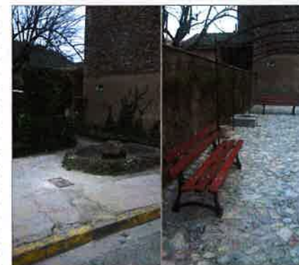
avant / après

Le « Jet d'eau » était autrefois, pour la grande majorité des Corrensois, un lieu de rencontres entre jeunes, un lieu d'échanges entre adultes, avec ses trois bancs et son bassin, son parterre de plantes et ses rosiers.