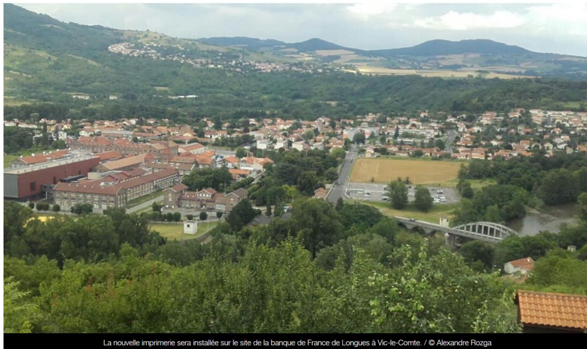
La nouvelle imprimerie sera installée sur le site de la banque de France de Longues à Vic-le-Comte.

La Banque de France a dévoilé le 5 juillet le projet architectural en forme de volcan de sa nouvelle imprimerie. Premier fabricant de billet de la zone euro, l'établissement public va transférer son imprimerie de Chamalières à Vic-le-Comte (63) sur le site où sont détruits les billets usagers.