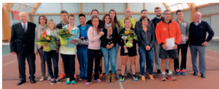
« L'ensemble des récompensés de l'open 2015 »

Rendez-vous en 2016 pour la prochaine édition de l'Open