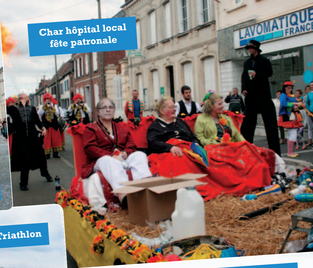
Char hôpital local fête patronale