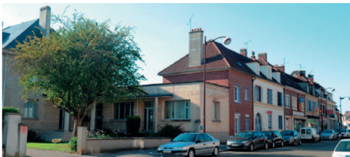
La maison du docteur de Saint-Fuscien, à droite sur la première photo, en 1908, la deuxième photo, dans l'autre sens, en 1905 et aujourd'hui, en 2015, exactement au même emplacement, la demeure reconstruite après 1945, où vit toujours la famille de Saint-Fuscien.