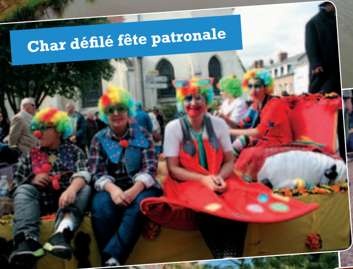
Char défilé fête patronale