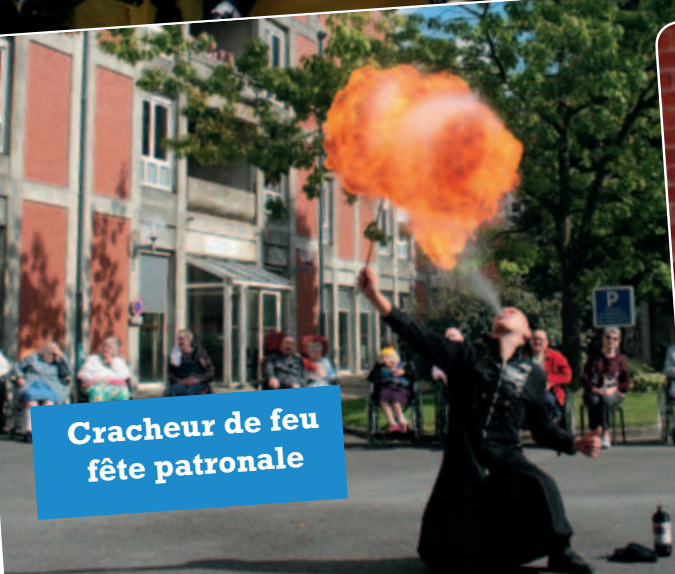
Cracheur de feu fête patronale