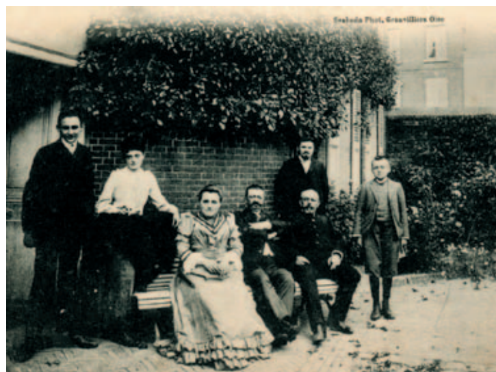
Famille de Saint-Fuscien, en 1905. Très bon cliché et très rare photo de Svobada, photographe turc qui a eu pignon sur rue durant deux ans au début du XX ème siècle, au 5 rue d'Amiens.

Je ne rappellerai pas ce qu'il fit à l'Hôtel de Ville pendant la paix. Mais je sais bien qu'il y fit, en 1914 et en 1918, quand l'invasion allemande rejeta sur nos villes et nos villages ces milliers de réfugiés, la plupart sans ressources. Je sais bien qu'il fit, alors que toute l'armée française défilait par Grandvilliers pour gagner le front de la Somme. Et je sais mieux encore ce qu'il fit en 1918, lors des sauvages bombardements de Grandvilliers.