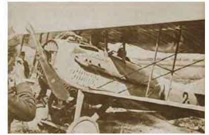
George Guynemer prepares for take off from Belgian Les Moeres aerodrome following repairs to a faulty water pump on 10 September 1917.