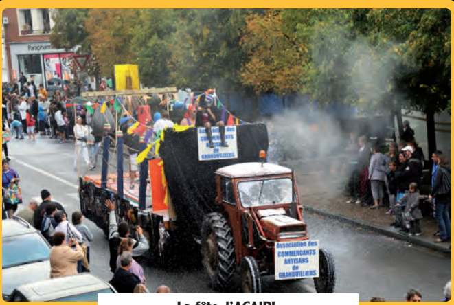
La fête, l'ACAIPL