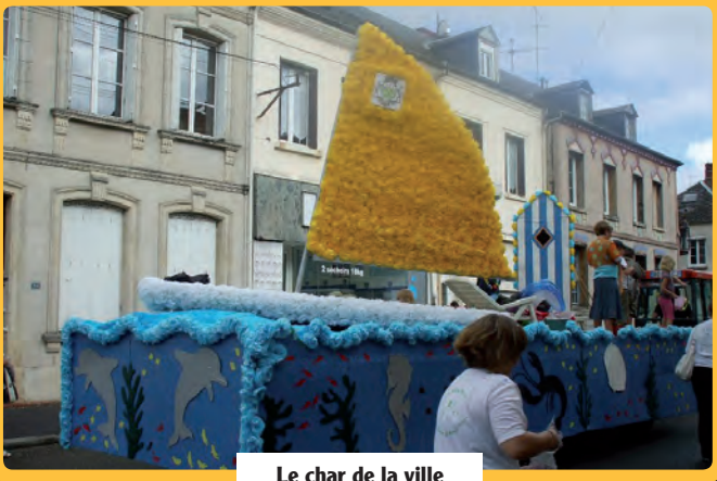
Le char de la ville