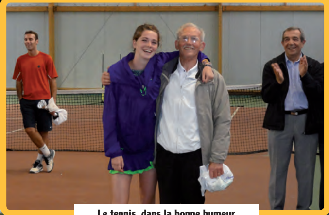
Le tennis, dans la bonne humeur