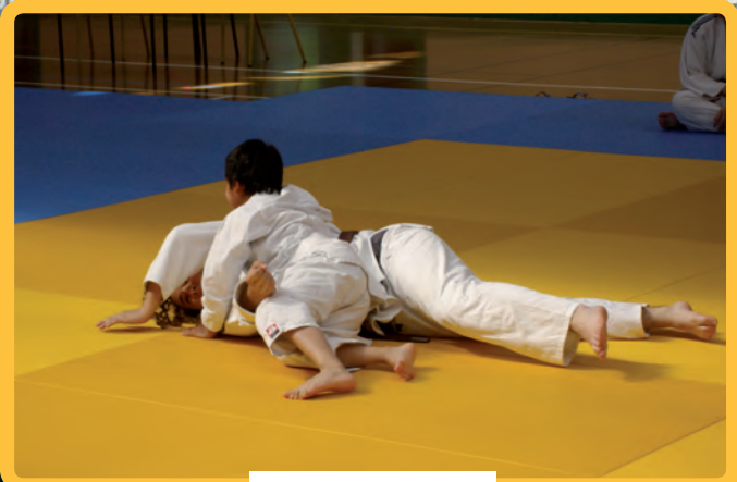
Tournoi du Judo Club