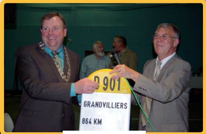
Une nouvelle borne à Athy