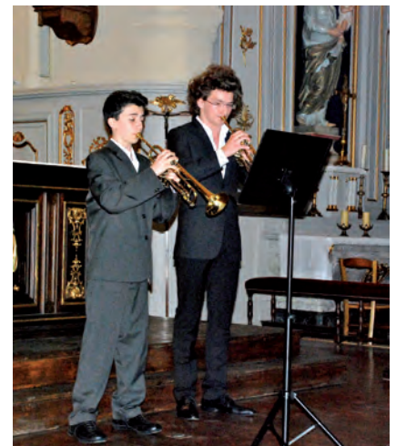
Musique sur Gardincourt