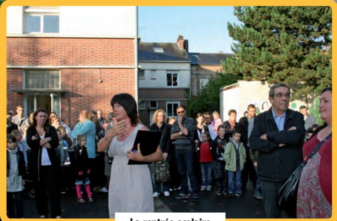
La rentrée scolaire