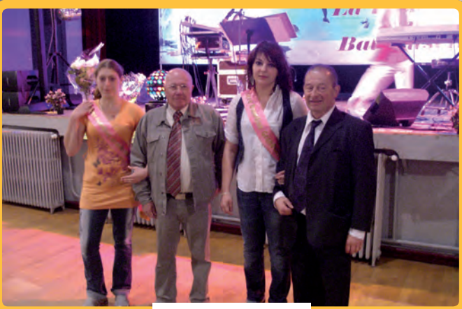
Le thé dansant