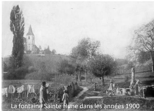
La fontaine Sainte Hune dans les années 1900

Aujourd'hui encore, elle est très appréciée, même si les usages ont changé : source d'eau pour l'arrosage des plantes, le lavoir couvert sert également d'arrêt de bus, notamment