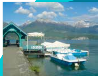
BATEAUX LES LOTUS