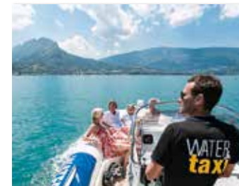
BATEAUX TAXI DU LAC

Été comme hiver, cours de wakeboard, wakesurf, wakeskate, ski alpin, slopestyle, freestyle, freeride, twinskate, handi ski, baby ski, location de bateaux et de paddle. 525 route d'Albertville +33 (0)6 09 96 65 08 www.ski-wake.com