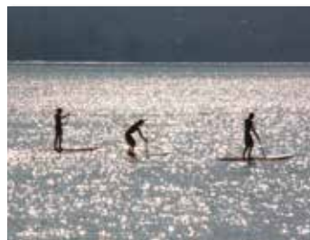
STAND UP ANNECY