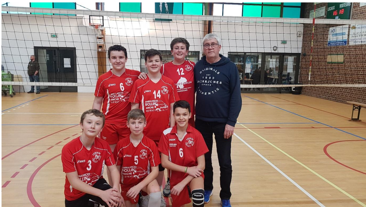
L'équipe des minimes garçons finit 5 ème du championnat.