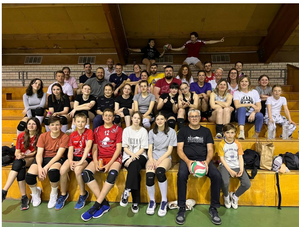
Quant à notre équipe loisirs, elle a effectué 4 tournois avec 2 équipes engagées.