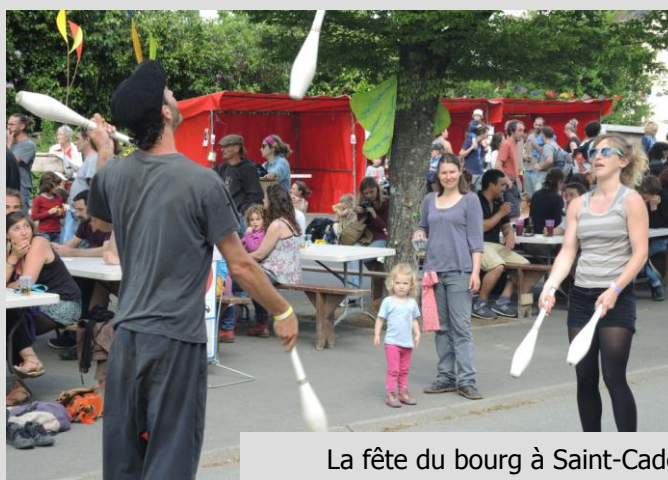
La fête du bourg à Saint-Cadou