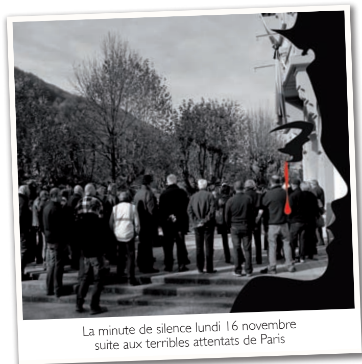
La minute de silence lundi 16 novembre suite aux terribles attentats de Paris

Parce que nous avons tous un regard différent sur notre ville, envoyez vos photos de Villard-Bonnot (ou vos dessins, vos créations...) avec vos coordonnées à l'adresse suivante : com@villard-bonnot.fr