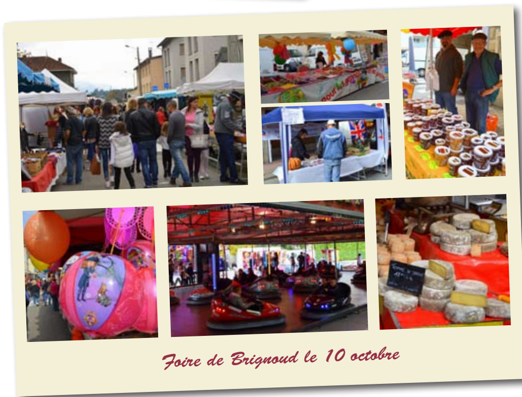
Foire de Brignoud le 10 octobre

Dernière minute Fermeture état civil : Samedi 26 décembre Samedi 2 janvier