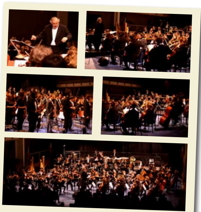
Concert du Conservatoire National Supérieur de Musique de Lyon le 27 novembre