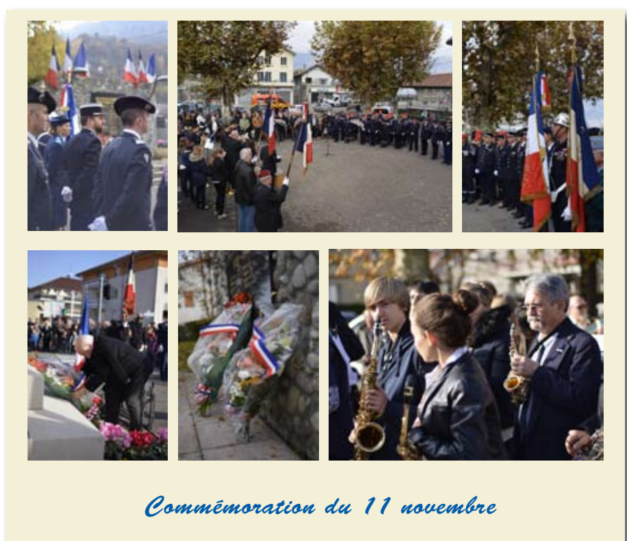
Commémoration du 11 novembre