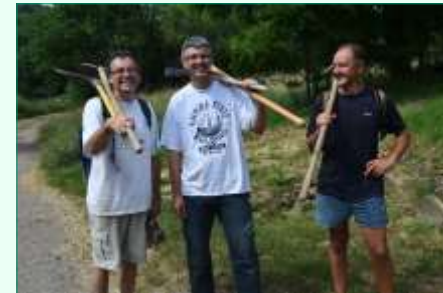
Au fond de la forêt, les hommes des bois s'organisent : curage des fossés, pose de nouveaux bois d'eau... Ils n'économisent pas leurs forces !