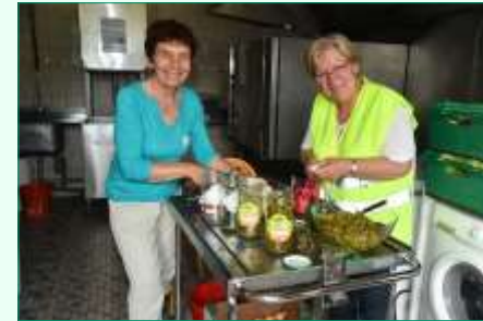
Les cuisinières prennent possession de la cuisine du foyer communal. La corvée de pluches, effectuée dans la bonne humeur, permet la réalisation de la meilleure des salades de pommes de terre de la région. Et que dire de la salade de fruits maison !

Les équipes sont constituées et s'égayent rapidement dans le village en direction de leurs postes de travail.