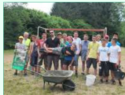
Pendant ce temps, à l'orée de la forêt, au lieu dit la « Munimatta », une quinzaine de jeunes s'activent pour aménager leur terrain de foot. Débroussailler, pelleter, ratisser, ensemercer... la journée a été longue... et rude sous le soleil. Mais chapeau bas, les jeunes !

Le préau de l'école est devenu le royaume des peintres. Jeunes et moins jeunes montent et descendent des escabeaux, brossent, frottent et repeignent les boiseries. Une autre équipe s'attaque aux vieilles portes des caves de la mairie et leur redonne une nouvelle jeunesse.