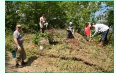
Notre village cache des vestiges patrimoniaux insoupçonnés : deux postes de guet, datant de la 1 ère Guerre mondiale, étaient envahis par le lierre et les ronces. Quatre courageux se sont mis à l'ouvrage et, au prix de beaucoup de coups de pioche et de sueur, ont réussi à les remettre à jour.