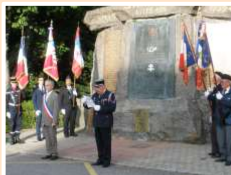
7 mai : commémoration de la Victoire de 1945