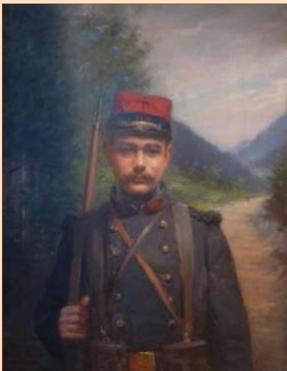
Portrait de François Boucher par Honoré Umbricht (1915). Huile sur toile. Musée Charles de Bruyères, Remiremont

François Boucher reçut la médaille militaire et la croix de guerre avec étoile de bronze, à titre posthume, avec la citation suivante : « Sous-officier donnant à ses hommes le plus bel exemple en toutes circonstances. Tombé glorieusement pour la France, le 2 janvier 1915, à Steinbach. Tué à l'ennemi. » François Boucher est inhumé dans le caveau familial de Gérardmer. Son nom est inscrit sur le marbre de l'École nationale des chartes et de la Bibliothèque Nationale.