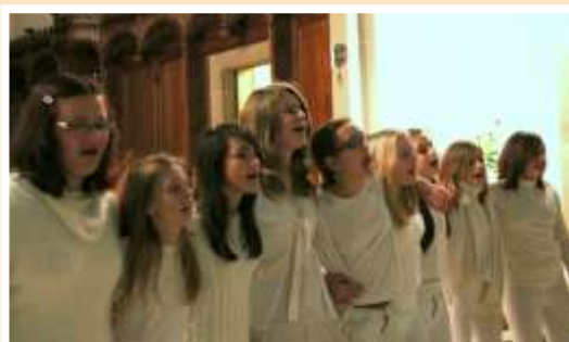
18 janvier : « Noël sans frontières », Concert plein de fraîcheur des « Cigal Angels » de Guebwiller, formation de 9 jeunes choristes.