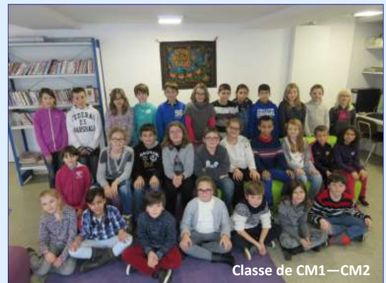
Classe de CM1—CM2