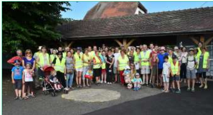
Ce samedi 6 juin 2015 à Steinbach...

Une journée citoyenne remet ainsi au goût du jour les valeurs de Respect, Partage et Fraternité.