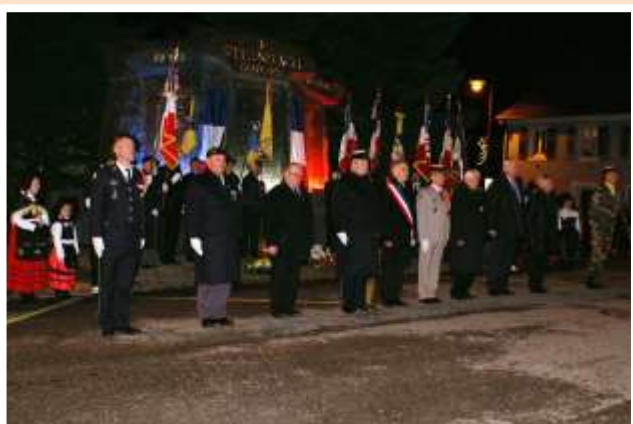
4 janvier : commémoration du Centenaire de la libération de Steinbach (évoquée dans le Bulletin Municipal 2015).