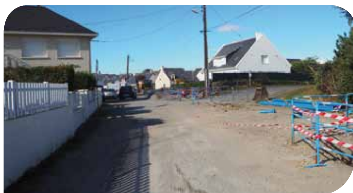
Rue de Trémondais