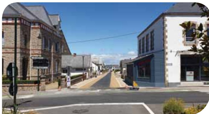
Rue de la Gare

Des points de vigilance demeurent sur le bon niveau d'entretien patrimoniale de l'église, notamment au niveau du clocher de la tour. Des études pourraient donc reprendre en vue de nouvelles phases de travaux ■