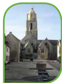
entrée par le porche côté Place du Garnal).

Cette balade débute Place du Mûrier, devant cet imposant édifice bâti au XV ème siècle. "Que lui est-il arrivé ? Un orage, une tempête ou la guerre ?"