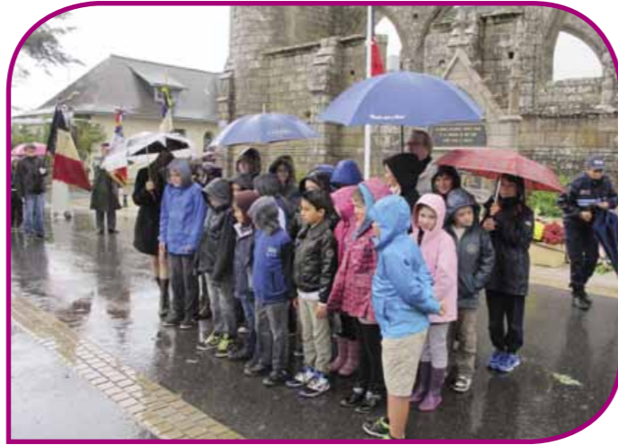
Les élèves de la classe de CE2-CM1-CM2 de l'école Alain Boutle ont bravé les éléments pour chanter la Marseillaise, apprise en classe aux côtés de l'UNC.

Le devoir de mémoire et la transmission entre les générations ont pris tout leur sens ce 11 novembre 2014. Avec le soutien des membres de l'Union Nationale des Combattants, les enseignantes du cycle III du groupe scolaire Alain BOUTLE ont appris aux enfants à chanter "La Marseillaise". C'est sous une pluie battante en clôture du protocole que la vingtaine de jeunes Batziens a entonné avec enthousiasme les deux premiers couplets.