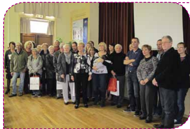
Bienvenue à tous les nouveaux arrivants, petits et grands !

Dans son discours d'accueil, Madame la maire de Batz-sur-Mer a d'ailleurs insisté sur le rôle des associations dans la dynamique locale de la commune nécessaire au bien vivre ensemble ■