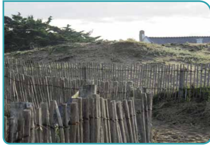
Dune de la falaise