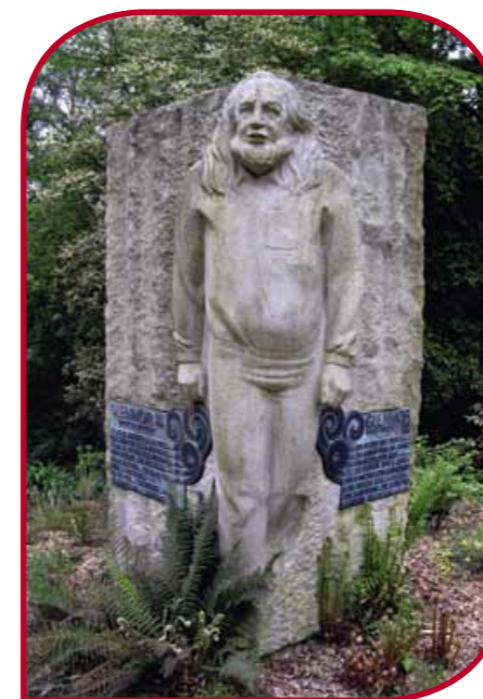
Glenmor, Jardin du Thabor