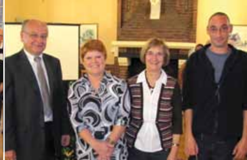
3 octobre : remise des médailles du travail