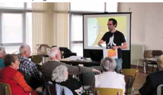
du 9 au 11 octobre : fête de l'énergie