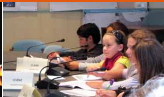
8 octobre : séance plénière du conseil municipal des enfants