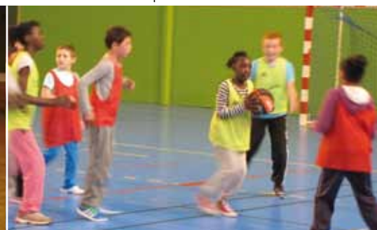
15 octobre : rencontres sportives de basket inter-école