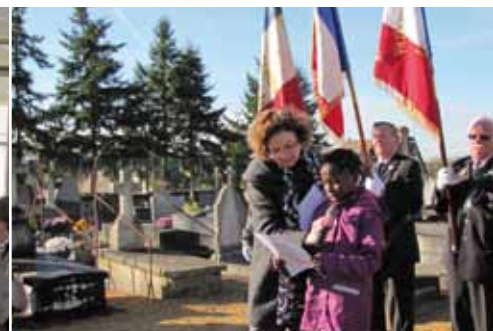
11 novembre : cérémonie de commémoration de l'Armistice de 1918