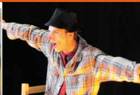
8 octobre : spectacle «Tombé sur un livre» à la bibliothèque