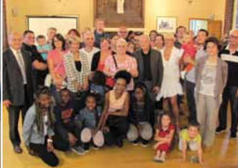
3 octobre : accueil des nouveaux habitants