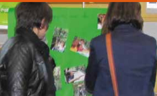
7 octobre : expo photos du stage «forêt» du programme de réussite éducative