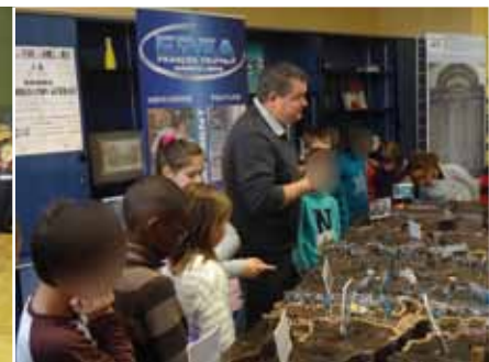
Du 4 au 10 novembre : exposition sur le Centenaire 14-18