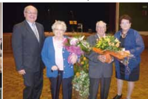
12 octobre : repas des seniors et des aînés