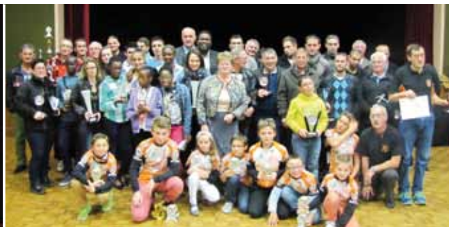
24 octobre : cérémonie de récompense des sportifs méritants