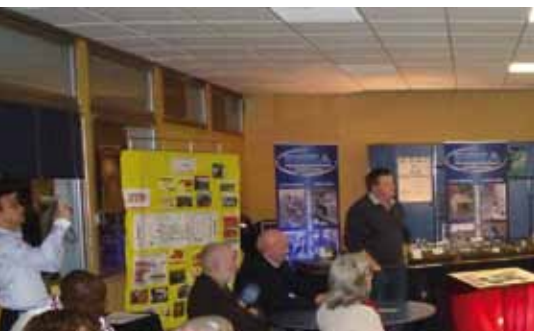
6 novembre : rencontre-débat sur le Centenaire 14-18