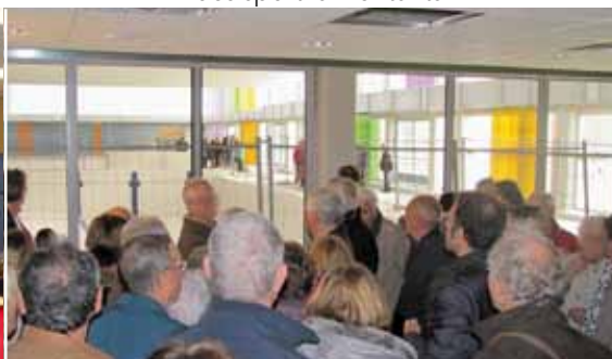
8 novembre : visite des travaux de la piscine des Vauroux