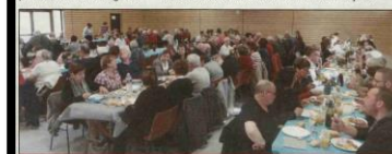
Au total, ce sont 200 repas qui ont été servis.

Tous les habitants de Olouise sont déjà conviés pour la fête des voisins qui se déroulera le 17 juin.