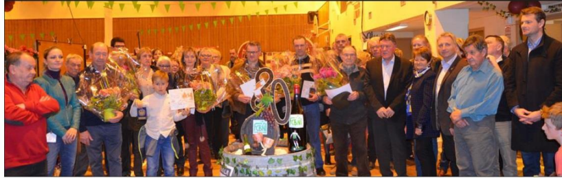
Les petits vignerons locaux primés ont reçu médailles, diplômes et fleurs.

D'autant que les 70 échantillons en lice, issus de 34 vignerons, se présentaient dans l'ensemble avec une belle robe, un nez souvent engageant et un passage en bouche long et gouleyant.