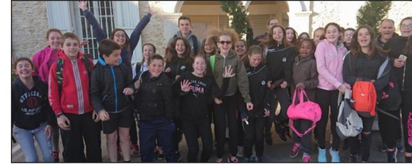
La sortie d'un véritable simulateur spéléo offrant plus de 120 mètres de galeries.