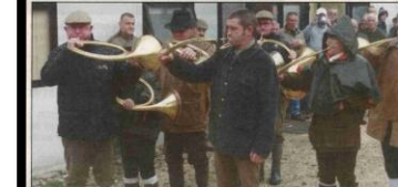
L'équipe Marque et Garçon.

En fin de matinée, tous se sont retrouvés à la cabane de chasse pour déguster des diots, accompagnés de frites et de chou à la crème.