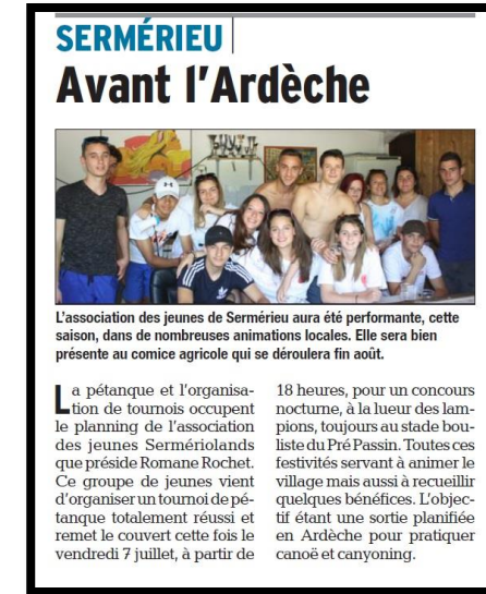
2017-06-18 A.J.S challenge pétanque - Le Dauphiné Libéré