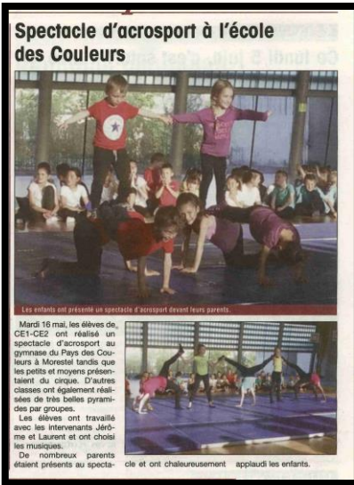
2017-06-02 Spectacle acroSPORT à l'école des couleurs - Le Courrier Liberté