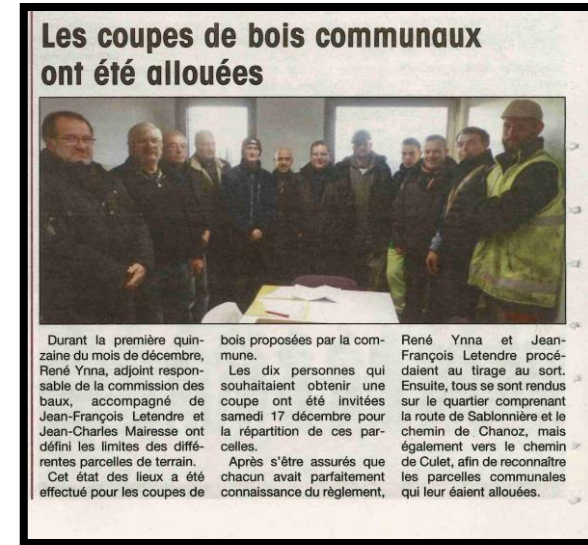
2017-01-06 Les coupes de bois allouées - Le Courrier Liberté