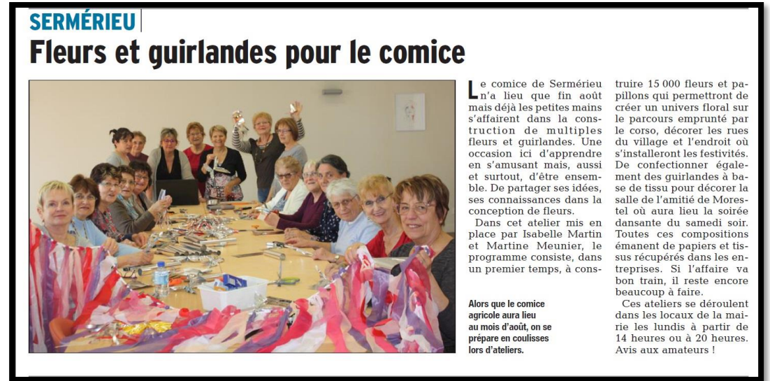
2017-04-01 Fleurs et guirlandes pour le comice - Le Dauphiné Libéré