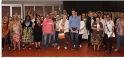
Comme conseillé par l'assemblée, les enfants, les jeunes et les adultes bressois, en centre social, des activités de loisirs structurées, répondant à leurs besoins et favorisant le respect de l'autre, dans toutes ses dimensions.

Il est porteur de projets participatifs, pour que les habitants prennent des initiatives, mettent des actions personnalisées solidaires et concertent toutes les priorités, de la petite enfance aux personnes âgées. La coordination du "contrat enfance jeunesse" sur le territoire est conduite par la CAF et la mairie de Morestel, à une semaine du centre social.