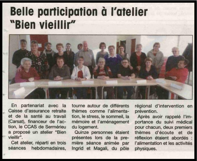
2017-01-13 atelier bien vieillir - Le Courrier Libéré