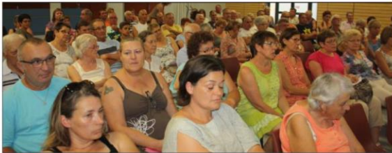
La population a répondu présente à cette réunion publique sur le prochain comice agricole.

Ambiance rurale et pay-sanne authentique, sera le leitmotiv du prochain comice agricole cantonal, qui se déroulera les samedi 26 et dimanche 27 août, à Sermérieu. Ce comice mobilise depuis neuf mois les énergies de l'équipe organisatrice. Il lui reste deux mois pour peaufiner les ré-