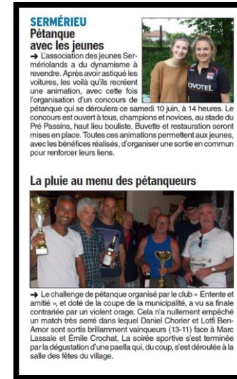
2017-06-08 AJS concours pétanque + Entente et amitié pétanque Challenge de la municipalité- Le Dauphiné Libéré