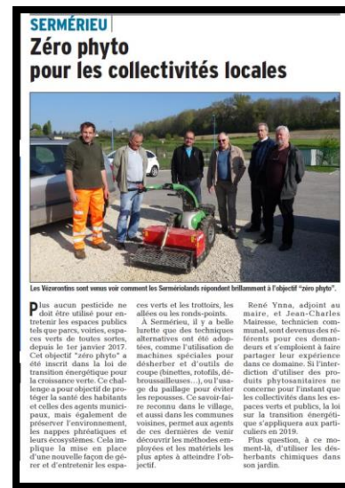
2017-04-17 Zéro phyto pour les collectivités - Le Dauphiné Libéré