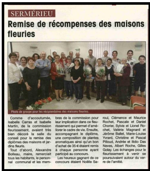
2017-04-14 Remise des récompense maisons fleuries - Le Courrier Liberté