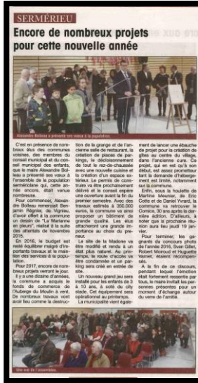
2017-01-13 Les vœux du Maire - Le Courrier Libéré

En Nord-Isère, une voiture sur le toit et six camions bloqués Un accident sans doute dû aux conditions climatiques s'est produit hier matin à Sermérieu, sur la RD244, en direction de Sallagnon. Sur cette route sinueuse en pente, un véhicule s'est retrouvé sur le toit. Ses deux occupants se sont extraits par eux-mêmes de la voiture. Vers 9 h 40, les pompiers ont été appelés. À l'arrivée des secours, les deux personnes se sont plaintes de douleurs au niveau de la tête et des cer-