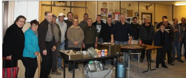
Les organisateurs ont permis à un nombreux public de découvrir le monde de la petite vénerie.