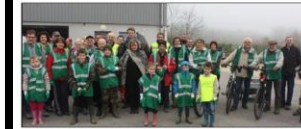
De très bonne heure, ce samedi, des personnes motivées sont venues participer au traditionnel ramassage de printemps.

Une bonne trentaine de personnes, dont quelques enfants, ont participé au ramassage des déchets sauvages dans la commune dans le but d'améliorer le cadre de vie de chacun. Les plus écologistes étaient même venus à vélo électrique. L'employé communal était lui arrivé