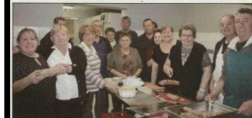
L'association Olouise Animation a organisé son traditionnel repas sabodets.

Dimanche 19 février, l'association Olouise Animation a organisé son traditionnel repas sabodets et gratin d'Olouise.