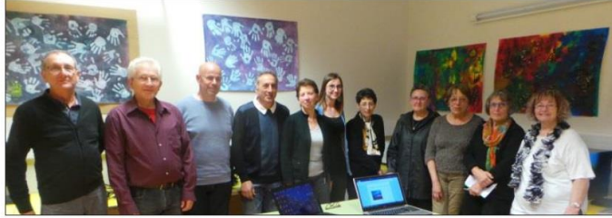
Les participants sont désormais à l'aise sur Facebook ou autres réseaux sociaux.

Ces séances étant jugées très performantes par les participants, de nouvelles pourraient prendre forme prochainement.