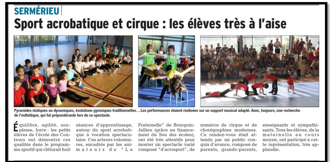
2017-05-20 Spectacle acrosports pour les élèves - Le Dauphiné Libéré