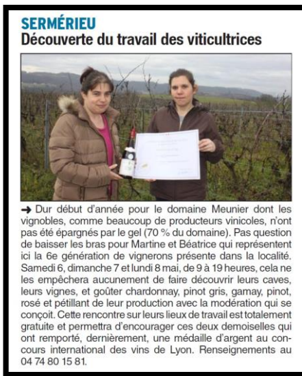
2017-05-05 Domaine Meunier - Le Dauphiné Libéré