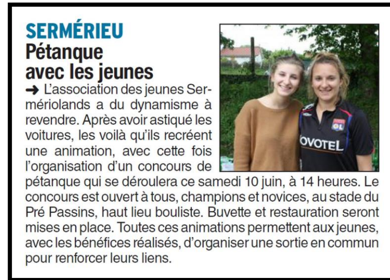
2017-06-08 Association des Jeunes Concours de pétanque - Le Dauphiné Libéré (1)