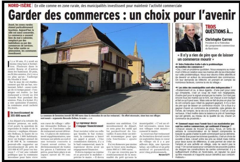
2017-03-24 Garder les commerces (2) - Le Dauphiné Libéré