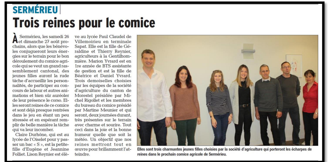
2017-04-04 Trois reines pour le comice - Le Dauphiné Libéré