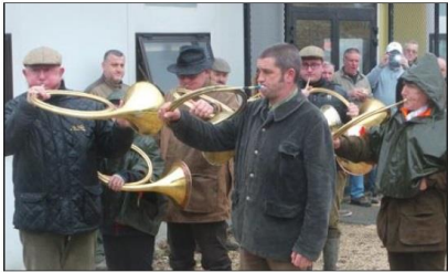
Les festivités furent ouvertes par les trompes de chasse de Porcieu-Ambagnieu.