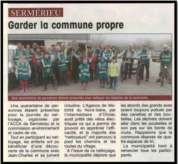
2017-04-07 Nettoyage de printemps - Le Courrier Liberté