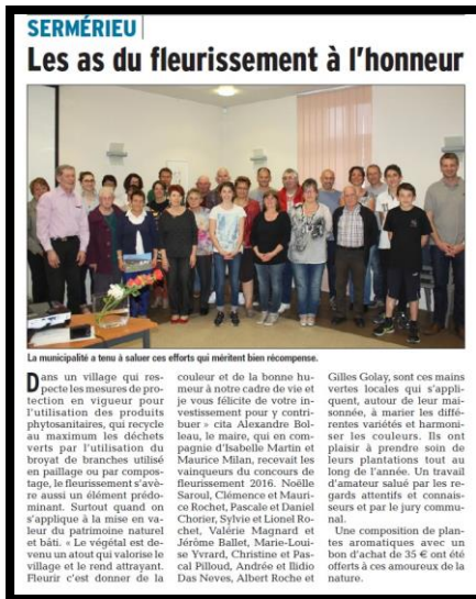
2017-04-02 Remise des prix des maisons fleuries - Le Dauphiné Libéré