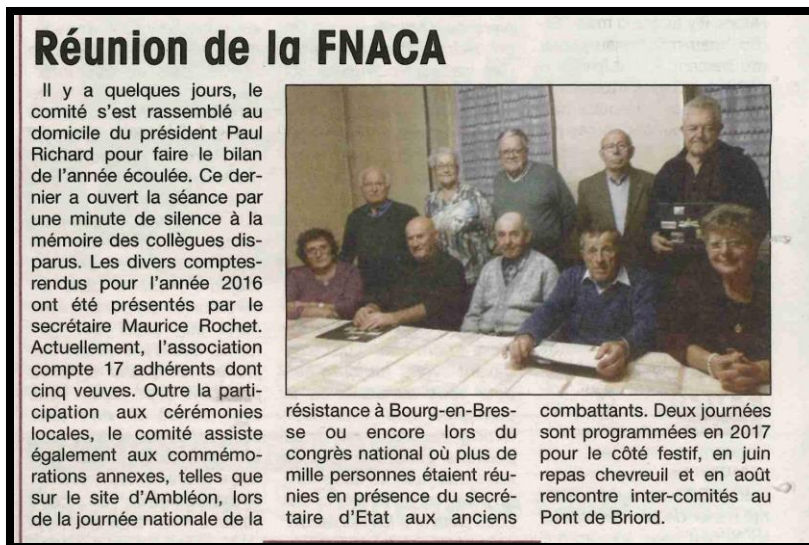
2017-01-06 Réunion FNACA - Le Courrier Liberté