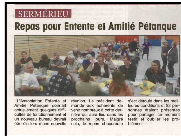
2017-02-10 Entente et amitié repas - Le Courrier Liberté