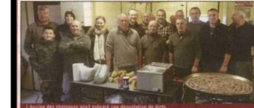
L'équipe des chasseurs avait préparé une déposition de diots.

L'équipe des chasseurs a organisé son animation de chasse au lièvre avec chien courant, appelée auvergnat chasse à courre.