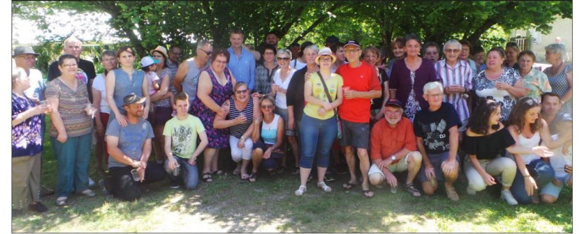
Cette fête des voisins est solidement implantée dans le hameau d'Olouise.