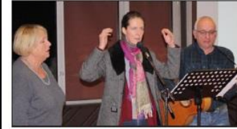
Une partie chantée servit d'enchaînements entre les différents sujets abordés au cours de la soirée.