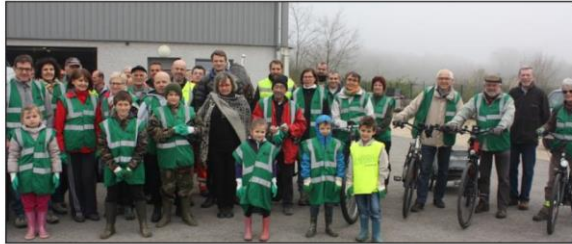
De très bonne heure, ce samedi, des personnes motivées sont venues participer au traditionnel ramassage de printemps.

Une bonne trentaine de personnes, dont quelques enfants, ont participé au ramassage des déchets sauvages dans la commune dans le but d'améliorer le cadre de vie de chacun. Les plus écologistes étaient même venus à vélo électrique. L'employé communal était lui arrivé