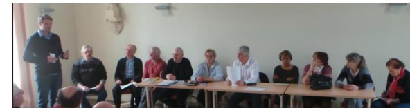
Une importante réunion, en présence du maire, a permis de relancer la pétanque sur des bases nouvelles au sein du village.

Le club "Entente et amitié", c'était l'an dernier pas moins de 7 concours de pétanque ouverts à tous et puis un certain essoufflement s'était fait sentir et beaucoup craignaient que l'association disparaisse. Que nenni ! Dans un club où on y vient par camaraderie pour se retrouver et parler du temps qu'il fait ou des