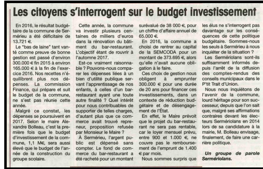
2017-06-02 Les citoyens s'interrogent - Le Courrier Liberté