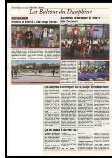
2017-06-02 Entente et amitié Challenge Paillet + Acrosport à l'école - Le Courrier Liberté