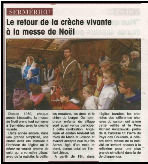
2017-01-06 La messe de Noël - Le Courrier Liberté