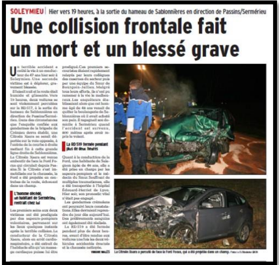
2017-01-13 Collision route de Sablonnières - Le Dauphiné Libéré