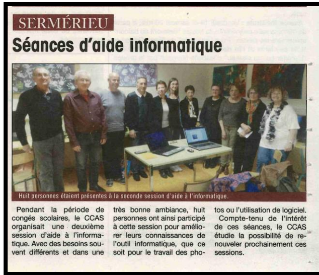
2017-05-12 Séances d'aide informatique 1 - Le Courrier Liberté