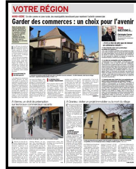
2017-03-24 Garder les commerces (1) - Le Dauphiné Libéré