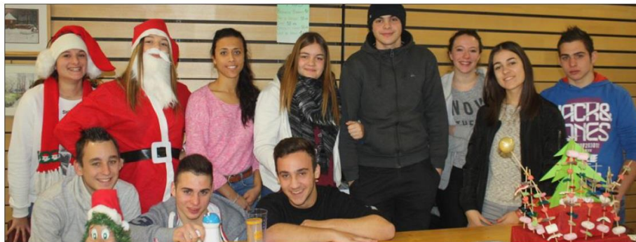
L'association des jeunes Sermériolands a du dynamisme à revendre. Elle a animé le marché de Noël. Ce samedi, c'est un bal costumé, ouvert à tous, qu'elle organise.

2017-03-04 Association des Jeunes de Sermérieu bal costumé - Le Dauphiné Libéré