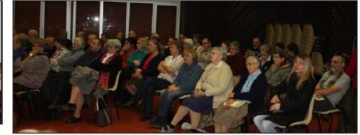
De nombreuses personnes ont participé activement à cette 1 re assemblée paroissiale.

Les territoires ne cessent de se recomposer et l'Église doit tenir compte de cette évolution et avancer avec ces nouveaux bassins de population.