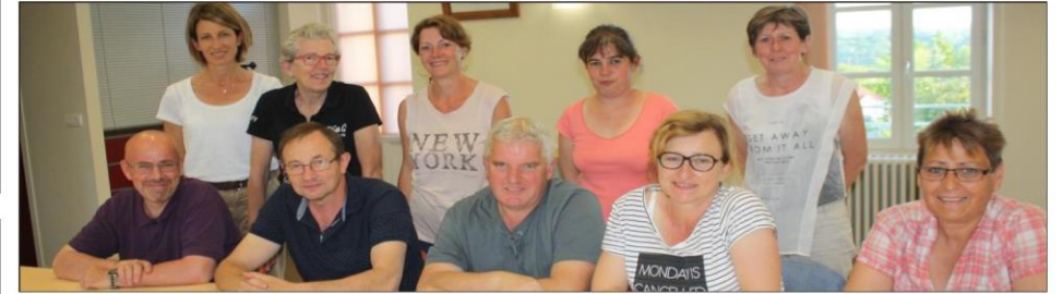
La commission "dîner dansant" met tout en œuvre pour offrir une soirée dansante digne d'un grand comice.

Ambiance rurale et paysanne authentique seront le leitmotiv du prochain comice agricole cantonal, qui se déroulera les samedi 26 et dimanche 27 août, à Ser-