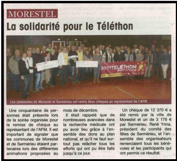
2017-02-03 Le Téléthon remise du chèque à l'AFM - Le Courrier Liberté