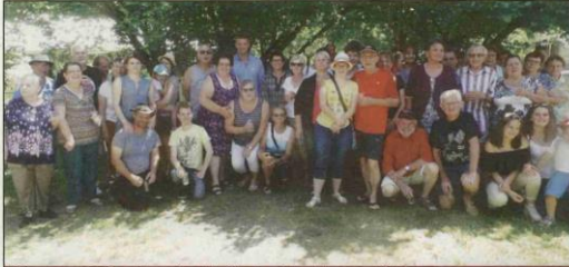
60 personnes réunies à l'occasion de la fête des voisins du hameau d'Olouise.

Une soixantaine de personnes se sont retrouvées à l'occasion de la journée des voisins du hameau d'Olouise.