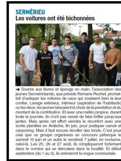
2017-05-17 AIS lavage de voitures - Le Dauphiné Libéré