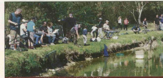
De nombreux amateurs étaient présents au safari truites de l'Acca.

Le safari truites de l'ACCA s'est déroulé dans des conditions pleinement favorables. Ce sont plus de quarante personnes et de jeunes ados qui se sont installés autour de l'étang de Pré Passins.