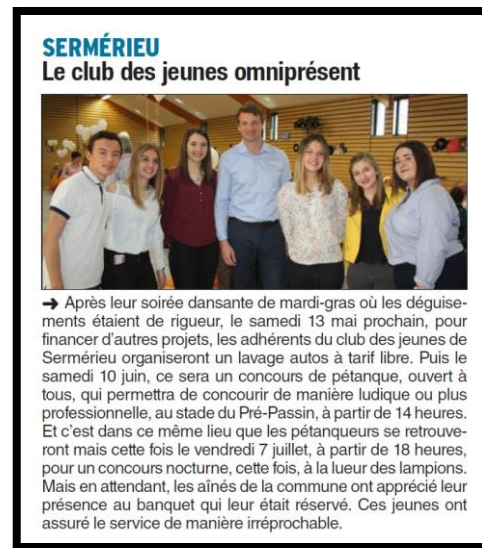
2017-04-21 Association des Jeunes de Sermérieu Service repas des aînés - Le Dauphiné Libéré