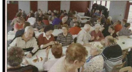
Après l'assemblée générale, les membres du club des Toujours Jeunes ont dégusté la galette des Rois.

Le club des Toujours Jeunes a dernièrement tenu son assemblée générale devant 82 personnes, soit une vingtaine de plus que l'an dernier. Les membres