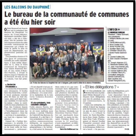
2017-01-13 Les Balcons du Dauphiné le bureau élu - Le Dauphiné Libéré