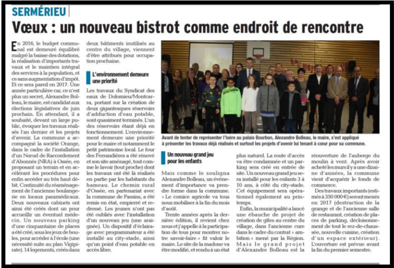
2017-01-12 Les voeux du Maire - Le Dauphiné Libéré