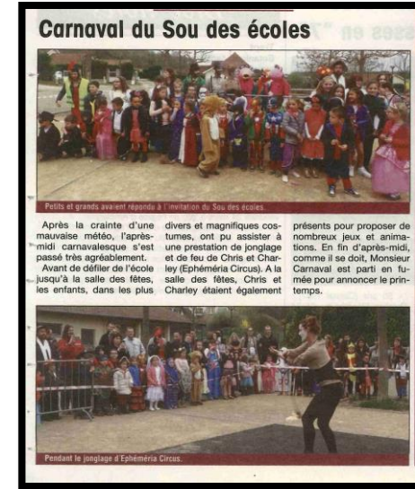
2017-03-24 Sou des écoles carnaval - Le Courrier Libéré