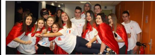
Les jeunes de la localité ont démontré leur dynamisme dans l'organisation d'une soirée dansante couronnée d'un joli succès.

Ils sont pour la plupart étudiants, pourraient certes être individualistes mais eux ont choisi de se fédérer au sein du club des jeunes de Sermérieu avec pour objectif de monter diverses animations dans le village. Et quand ils ne prêtent pas main-forte dans les organisations mises en place par la commune, ils deviennent des créateurs de soirée où ils font appel aux parents pour