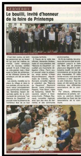
2017-04-28 La foire de printemps le bouilli - Le Courrier Liberté

2017-04-28 ACCA Safari truites - Le Courrier Liberté