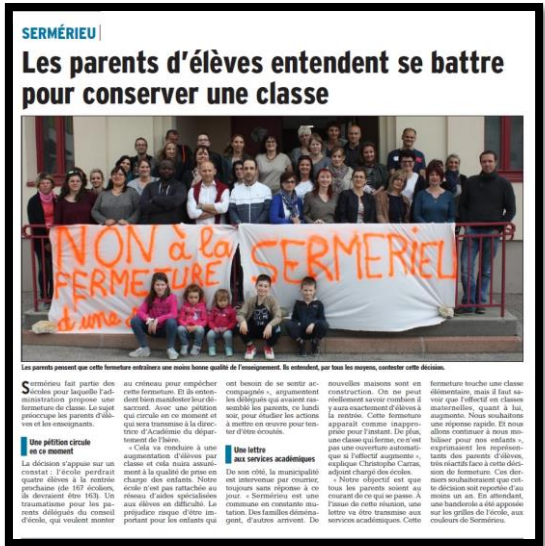
2017-04-05 Non à la fermeture d'une classe - Le Dauphiné Libéré