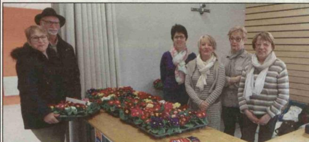
Les membres du CCAS ont organisé une vente de primevères au profit de la Ligue contre le cancer.

Les membres du CCAS ont profité de leur journée moules-frites pour organiser une vente de primevères au