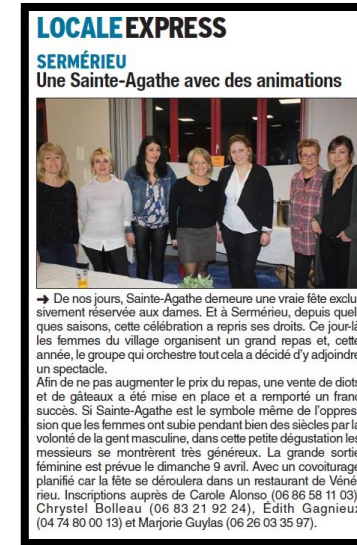
2017-02-07 vente de diots pour la Sainte-Agathe - Le Dauphiné Libéré