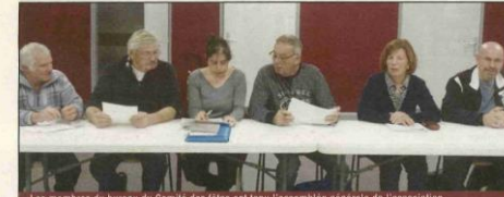
Les membres du bureau du Comité des fêtes ont tenu l'assemblée générale de l'association.

Dernièrement, le Comité des fêtes a tenu son assemblée générale. Le président remerciait toutes les personnes présentes, tout en regrettant que de trop nombreuses associations ne soient pas représentées. La trésorière a présenté les comptes qui s'avèrent assez satisfaisants, bien que cette année un investissement assez important ait été réalisé avec l'achat de