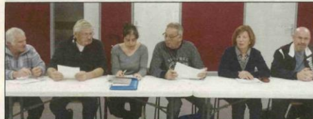
Les membres du bureau du Comité des fêtes ont tenu l'assemblée générale de l'association.

Dernièrement, le Comité des fêtes a tenu son assemblée générale. Le président remerciait toutes les personnes présentes, tout en regrettant que de trop nombreuses associations ne soient pas représentées. La trésorière a présenté les comptes qui s'avèrent assez satisfaisants, bien que cette année un investissement assez important ait été réalisé avec l'achat de