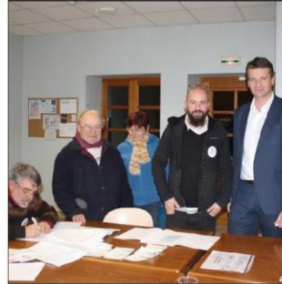
Les responsables des bureaux de vote du secteur de Morestel seront de nouveau dans l'action ce prochain dimanche pour le second tour de cette primaire du PS et de ses alliés.

maison des associations, pour les inscrits sur les listes électorales d'Arandon, Branges, Courtenay, Creys-Mépieu, Le Bouchage, Morestel, Passins, Sermérieu, Saint-Sorlin-de-Morestel, Saint-Victor-de-Morestel, Vézence-Curlin, Veyrins-Thuellin et Vigneau. Maison des associations, place du champ de mars, salle de Brièves, de Les Avenières, pour les électeurs de Corbeil, Granieu, Les Avenières et Vasselins. Salle des retrouvailles de la MJC, 16 b, route de Vassieu, de Montalieu-Vercieu, pour les électeurs de Bouvesse-Quirieu, Charrette, Montalieu-Vercieu, La Balme-Les-Grottes, Parmieu, Porcieu-Amblagnieu, Saint-Baudille-de-la-Tour et Vertrieu. Attention, les habitants de Veyrins-Thuellin votent au bureau de Morestel.