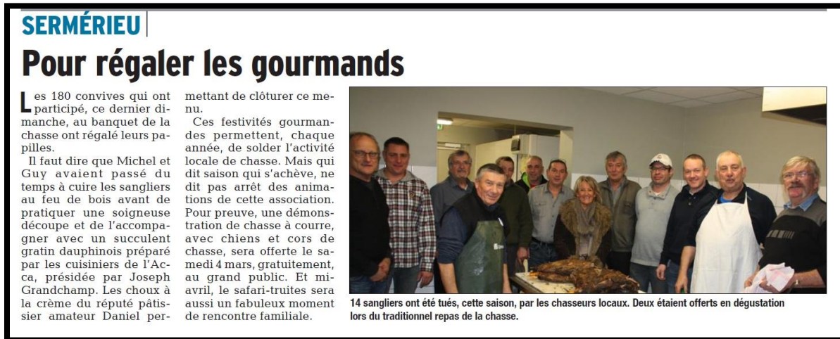
2017-02-09 Repas sanglier des chasseurs - Le Dauphiné Libéré