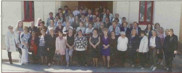
82 agathines avaient répondu présentes à l'invitation de "Sermerieu au féminin".

La 3 e édition de la Sainte Agathe, organisée par la nouvelle association Sermerieu au Féminin, a regroupé 82 agathines de tous âges qui se sont re-