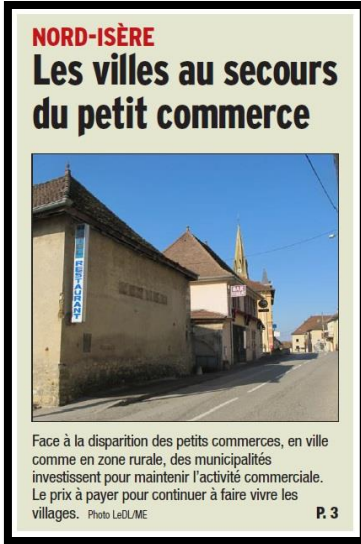
2017-03-24 Garder les commerces (0) - Le Dauphiné Libéré