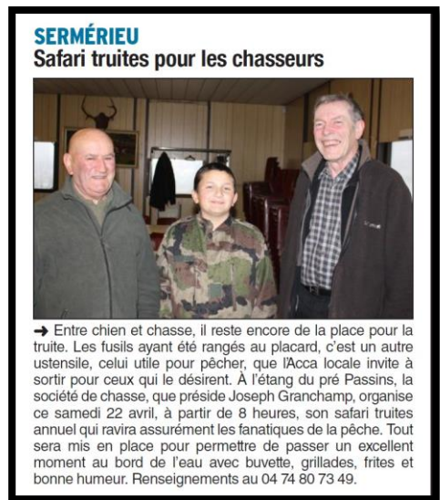
2017-04-19 Safari truites - Le Dauphiné Libéré