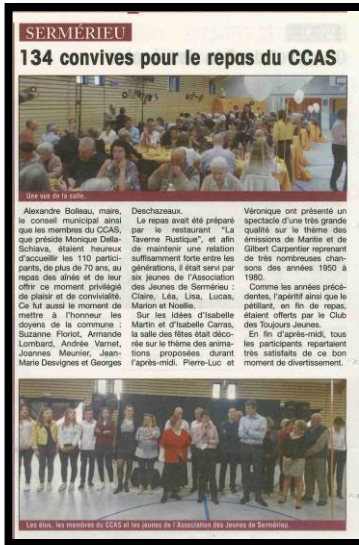
2017-03-31 Repas des aînés - Le Courrier Libéré