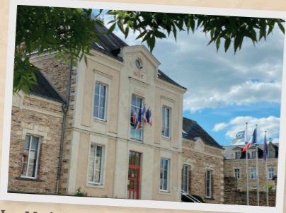
La Mairie aujourd'hui