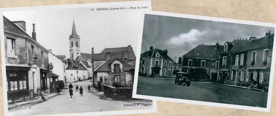
Coeur de bourg

Du breton « derv » (chêne) et « val » (vallée).