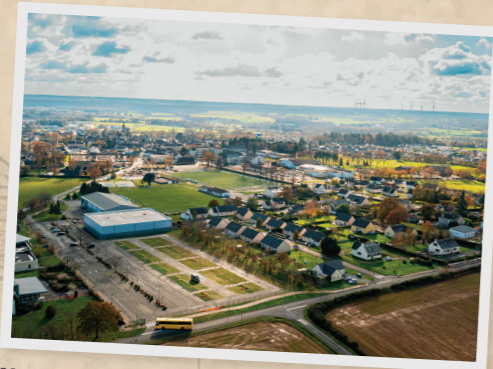
Vues de drone aujourd'hui