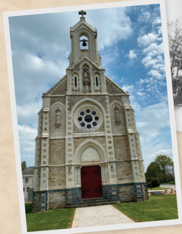
Espace Émilie Cherel