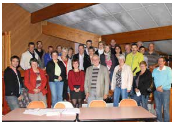
Séance d'installation des Comités de hameaux

Les coordonnées des représentants de chaque secteur pourront être communiquées à toute personne qui en fera la demande en Mairie au 04.50.02.91.72 ou accueil@mairie-thonos.fr .