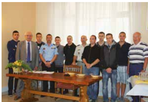
Cérémonie de signature de contrats d'engagement dans l'armée à Thônes le 1 er octobre 2014