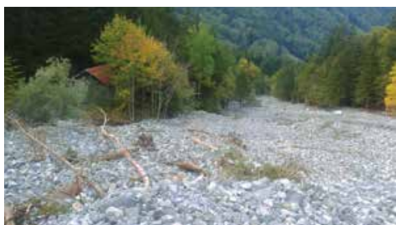
Une rivière de pierres