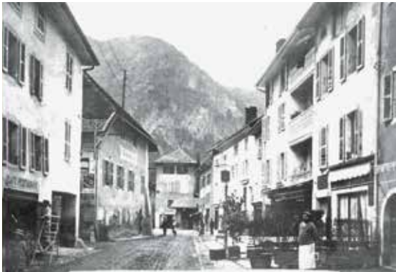
Thônes en 1914

"Veuillez aviser discrètement propriétaires d'animaux et de voitures réquisitionnées de se tenir prêts à conduire leurs animaux et voitures aux exercices de réquisition, au premier ordre qui sera donné."