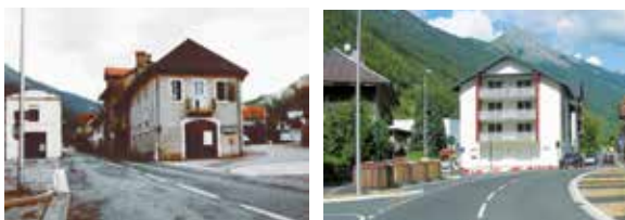
Une transformation qui s'est déroulée sur des années

Avec la dernière tranche de travaux réalisée à l'automne, la réhabilitation de la rue de la Saulne est aujourd'hui achevée. La transformation totale de cette rue n'a pu aboutir que grâce aux acquisitions foncières réalisées par les précédentes municipalités depuis près de 20 ans.