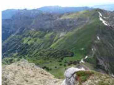
Alpage du Col de la Buffaz

Avec son statut de chef-lieu de canton, Thônes est une ville qui concentre une grosse partie des activités industrielles, artisanales et commerciales des Aravis. Avec sa situation géographique en fond de vallée, l'espace est donc restreint et précieux.