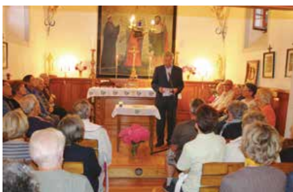
Inauguration de la Chapelle de la Vacherie

Cette rénovation engagée depuis plus de 20 ans, s'est achevée cette année par des travaux d'assainissement intérieur (parquets, peintures murales, peintures en trompe l'œil) et par la réfection de la façade principale. La chapelle a été inaugurée le 28 août, jour de la Saint Guérin, patron de la chapelle. De vifs remerciements sont adressés à toutes les personnes qui œuvrent à la préservation de notre patrimoine communal.