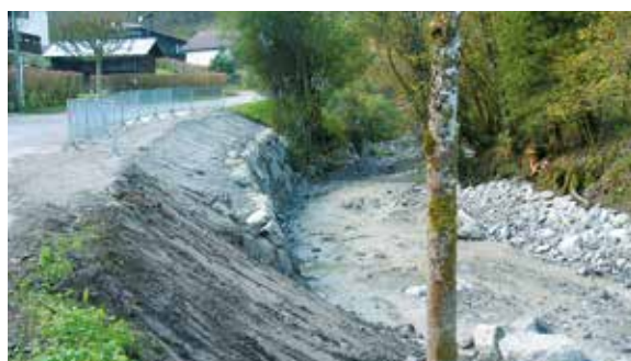
Travaux de protection des berges