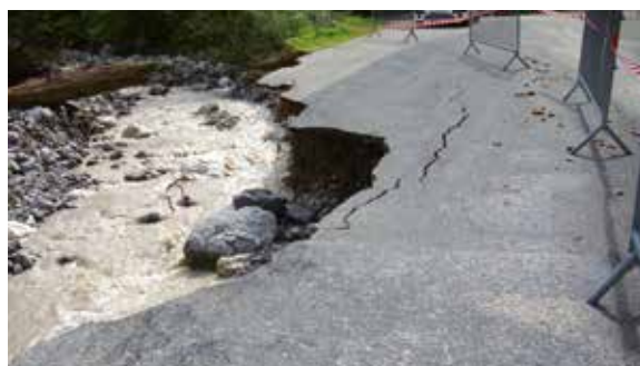
Des dégâts impressionnants