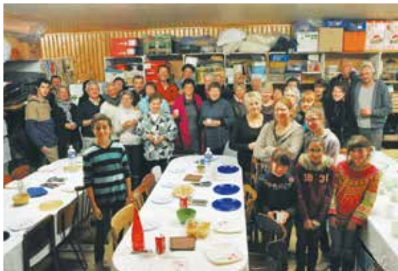
Le Secours Populaire, une association caritative active.

Avec des dotations de l'Etat en baisse, une augmentation du Fonds de péréquation des communes riches vers les communes pauvres (!), le transfert de compétences (réforme des rythmes scolaires), la commune de Thônes, comme toutes les communes, va devoir resserrer son budget.