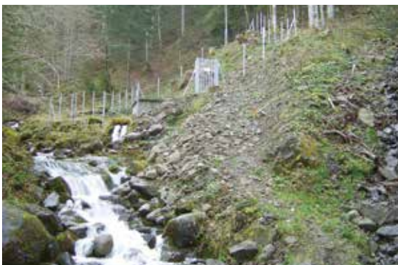
Protection du captage des Frasses

Un autre chantier vient juste de commencer dans le secteur des Perrasses. En lien avec la Régie d'Electricité de Thônes qui procède à une mise aux normes de ses réseaux, la commune en profite pour réhabiliter son réseau d'eau potable. Un groupement de commandes a été réalisé pour réduire les coûts. Ce chantier se terminera au printemps.