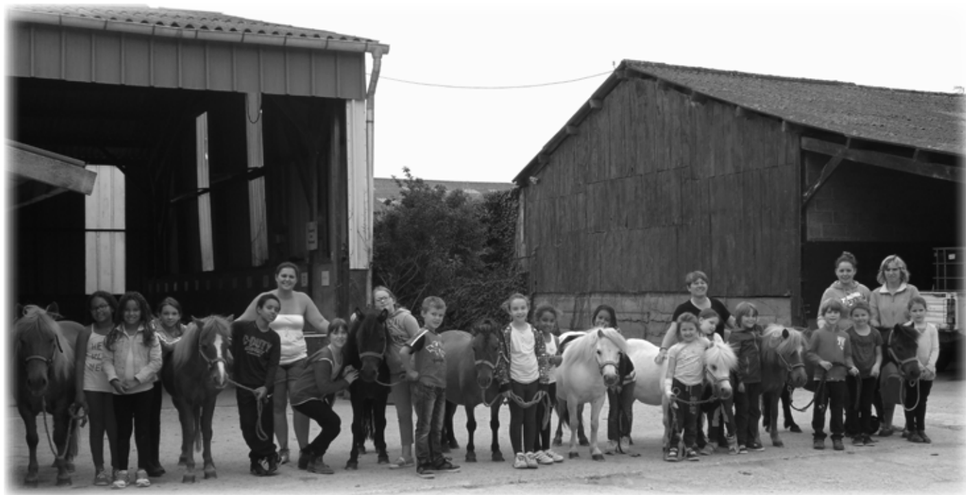
Les 6 -9 ans en stage poneys à la ferme du Syet

Fréquentation en hausse au centre de loisirs