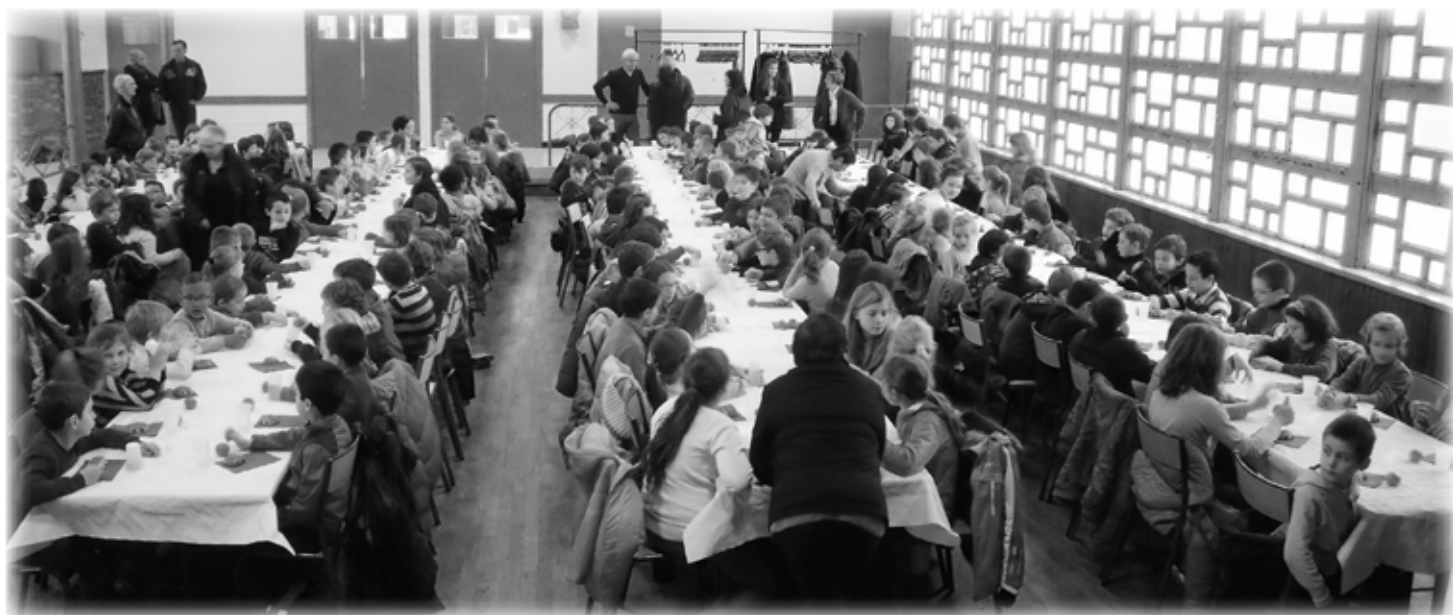
Le traditionnel goûter de Noël offert par la commune à tous les enfants de Rospez le 17 décembre avec en best star le Père Noël tout droit arrivé pour l'occasion du pôle Nord.