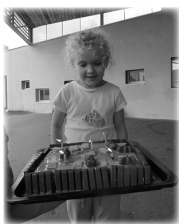
Les enfants ont réalisé un magnifique gâteau lors de l'atelier pâtisserie.