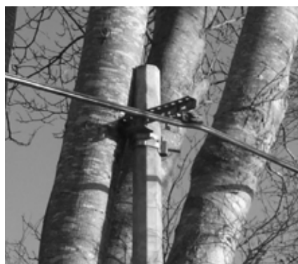
Exemple d'arbre non élagué

La Municipalité de Rospez rappelle aux propriétaires de terrains situés en bordure de route, qu'ils sont dans l'obligation d'élaguer leurs arbres. Ceci afin d'assurer de bonnes conditions de circulation sur la voie publique, et d'éviter que les câblages électriques et téléphoniques ne se coincent dans les branchages.