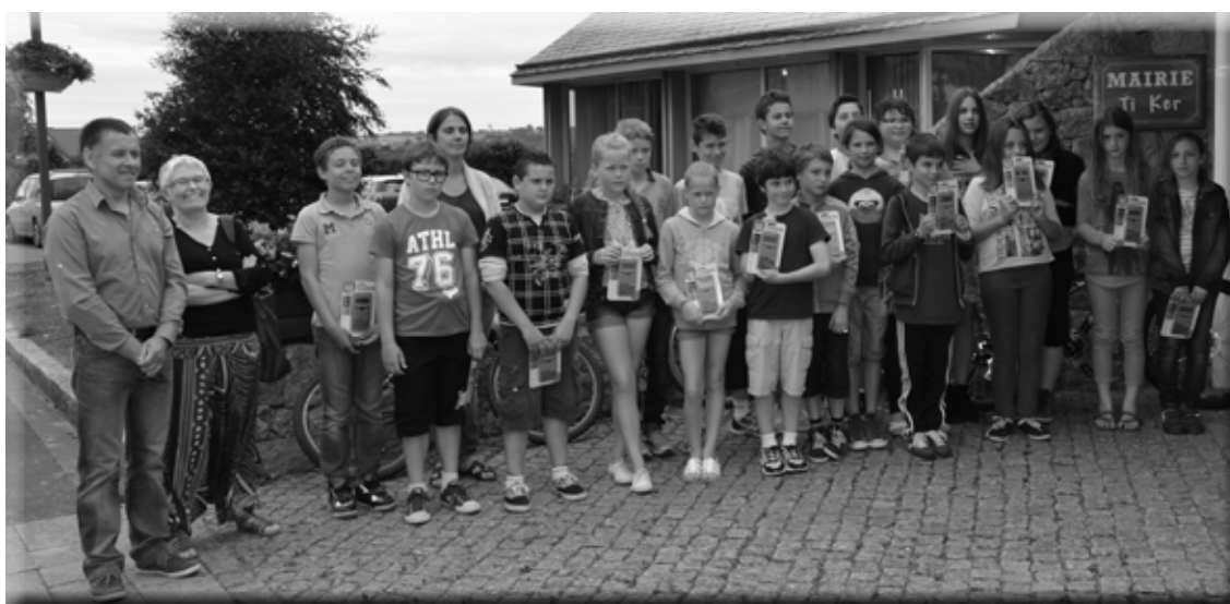
Le 26 juin 2015, a eu lieu la remise des calculatrices aux enfants de CM2.