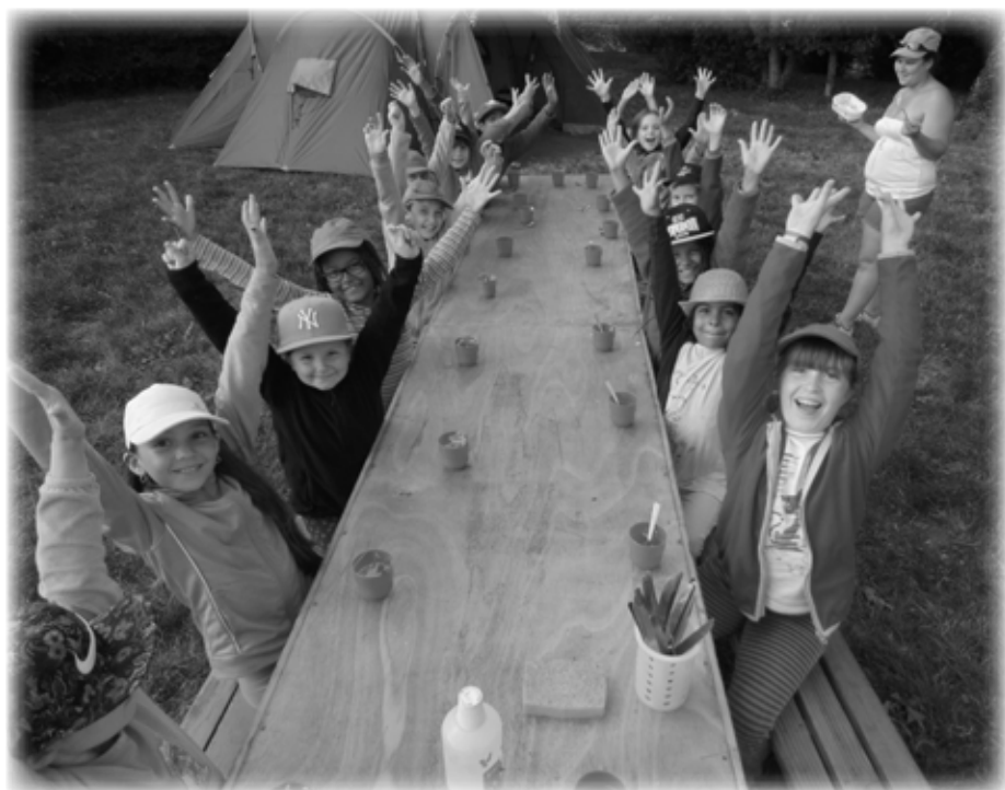
Les 6 -9 ans goûtent à la ferme du Syet

Tarifs en vigueur jusqu'au 30 juin 2015. Une nouvelle grille tarifaire sera communiquée début juin et appliquée à partir de juillet.