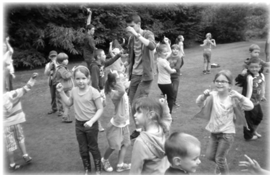
En répétition du spectacle de fin de centre

Les dossiers d'inscriptions seront disponibles en Mairie et sur le site de la commune www.rospez.fr à partir du 1er juin.