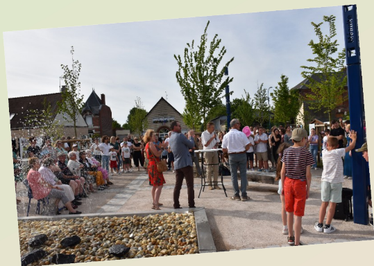
Le nouveau square de la Liberté