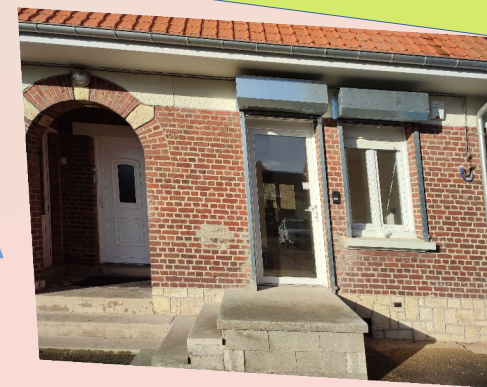
Une nouvelle Agence Postale Communale