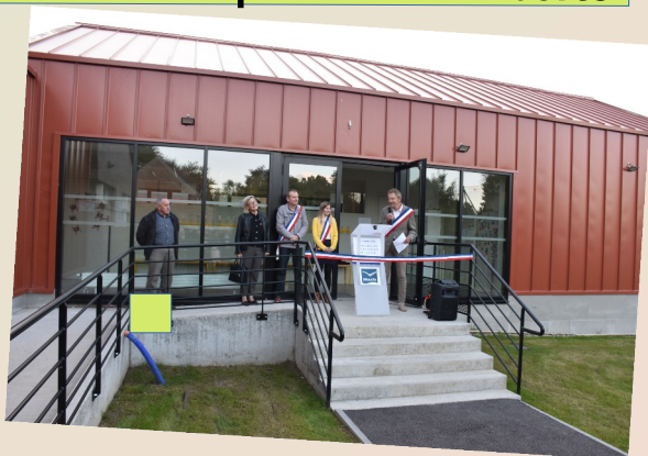
L'inauguration de 2 nouvelles classes