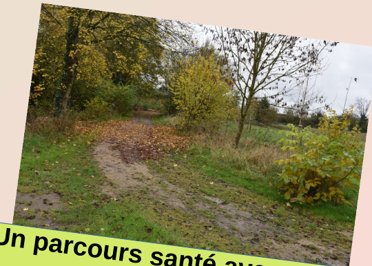
Un parcours santé avec agrès