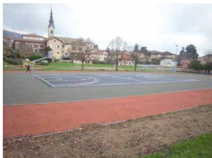
Rénovation de la piste d'athlétisme