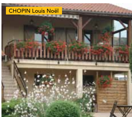
CHOPIN Louis Noël