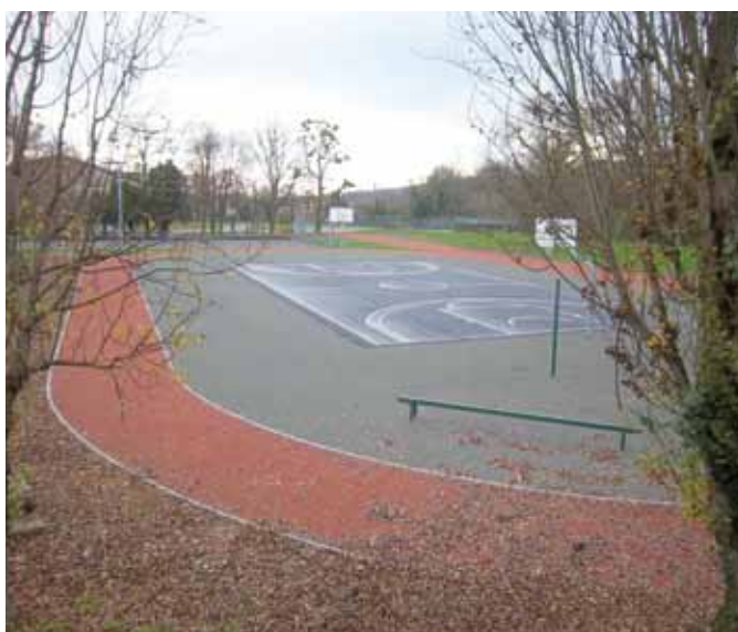
Réfection du terrain de basket