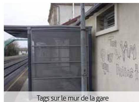
Tags sur le mur de la gare