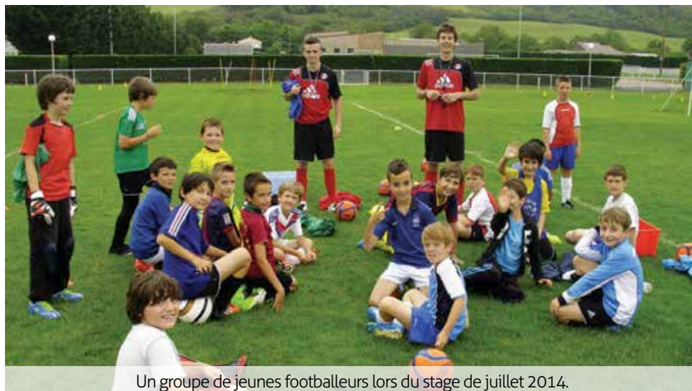
Un groupe de jeunes footballeurs lors du stage de juillet 2014.

Deux autres stages, à Pâques et en juillet, sont également prévus. Des informations complémentaires vous seront fournies prochainement. ■