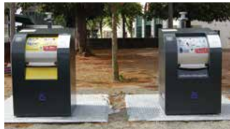
PAV (ou colonnes enterrées)