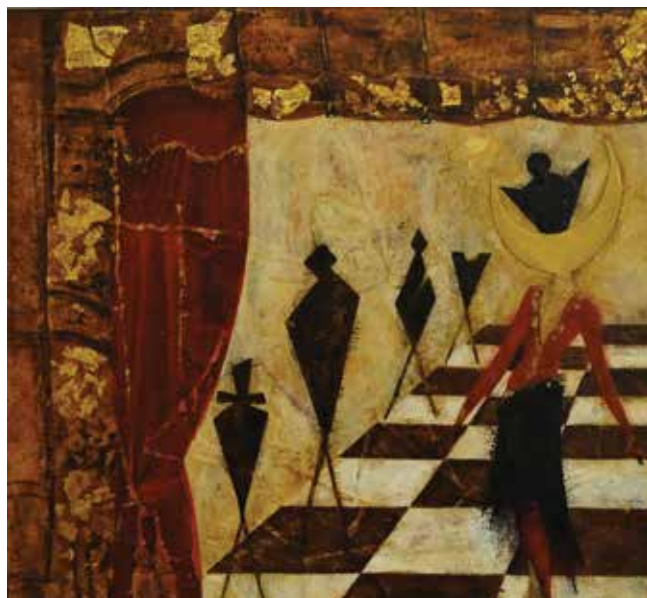
« La Reine de la nuit », peinture de Betty Ollier-Lopez