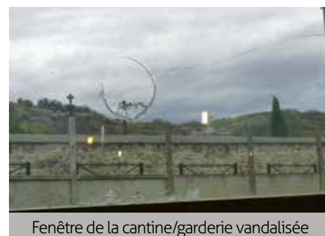
Fenêtre de la cantine/garderie vandalisée

Pour le bien-être de tous, respectons nos infrastructures et notre environnement. ■