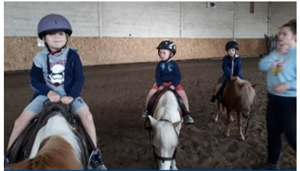
Activité très appréciée par les petits

Pendant toute la durée de ce séjour et avec le monde de Disney et de Pixar, les dessins animés ont été mis à l'honneur.