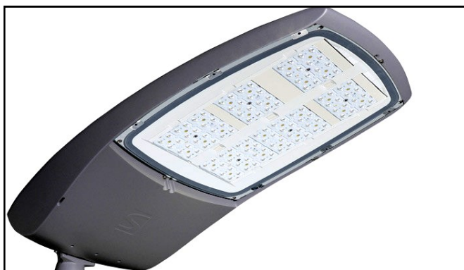
Une tête d'éclairage LED TECEO

La Municipalité s'est engagée dans la rénovation de l'éclairage public depuis 2014. Ces opérations ont été programmées de façon pluriannuelle afin de répondre aux nouvelles exigences environnementales (disparition des ampoules à mercure), mais également afin de générer des économies d'énergie.