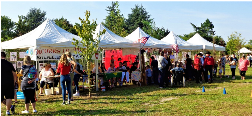
Ensemble, toutes les associations sur le pont ..