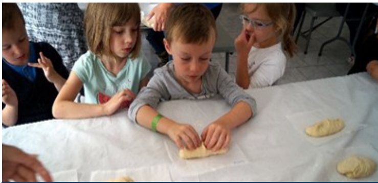
On met la main à la pâte ...