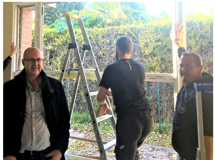
Remplacement des portes et fenêtres Salle Etef