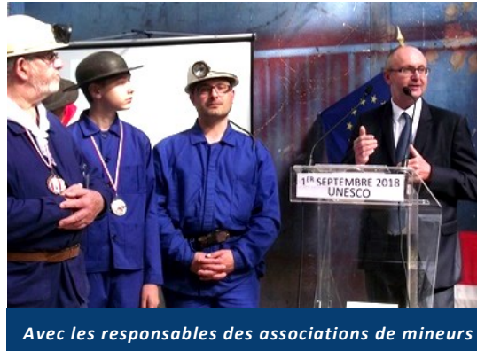
Avec les responsables des associations de mineurs

Samedi 1 er septembre, notre ville a été rythmée par de nombreuses activités au fil de la journée pour le plaisir des Estevellois.