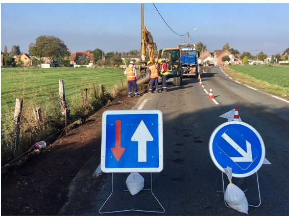
Un aménagement pour la sécurité de nos piétons

À la demande de Monsieur le Maire, l'accotement du CD164 est aménagé par le Conseil Département du Pas de Calais.