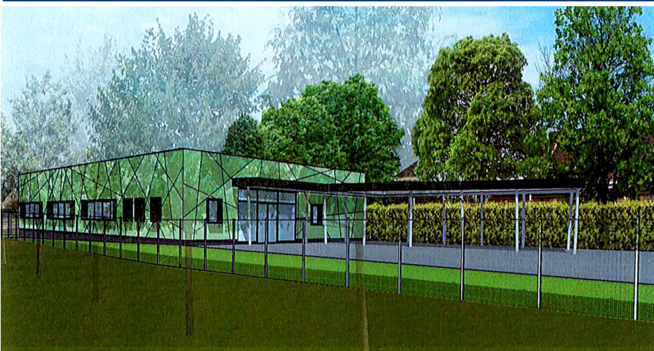
Vue des façades, un bâtiment éco-responsable qui s'intègre dans l'environnement

Un design haut en couleur parfaitement adapté au public avisé : l'enfant.