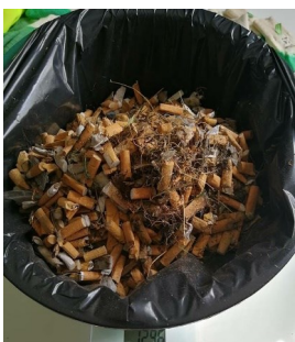
Stop aux mégots !