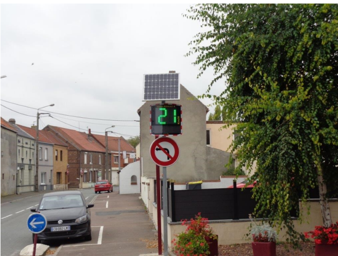
Installation de radars pédagogiques