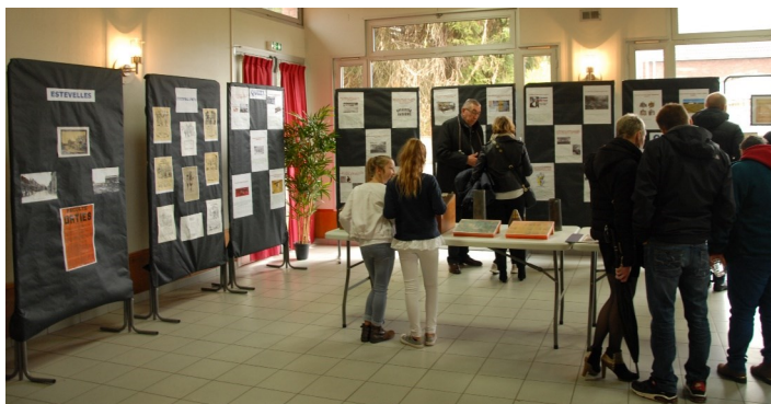
Une partie de l'exposition Salle ETEF