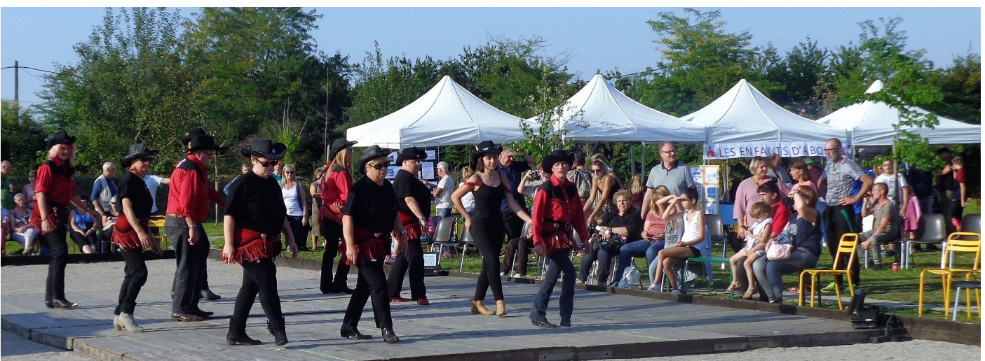
Démonstration par le Wild Eagles, club de Country d'Estevelles

Pour clôturer cette belle journée riche en souvenirs de fin de vacances, un magnifique feu d'artifices a été tiré, il restera dans toutes les mémoires.