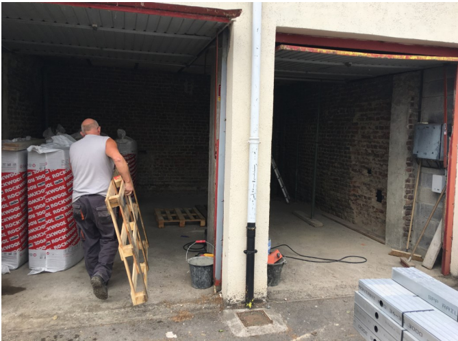
Création de bureaux dans les anciens garages, Avant...