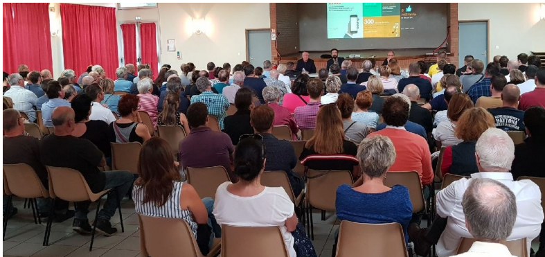
Les estevellois très attentifs lors de la réunion publique

Les Estevellois se sont rendus Salle ETEF Daniel FREMAUX fin septembre dernier, où un exposé leur a été fait sur le déploiement en cours de la fibre optique sur notre Commune.