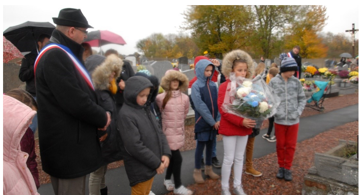
Hommage de nos petits Estevellois, le devoir de mémoire.

Cette manifestation s'est terminée par une distribution de porte bonheur des poilus "Nénette et Rintintin", les mascottes emblématiques de la 1ère Guerre.