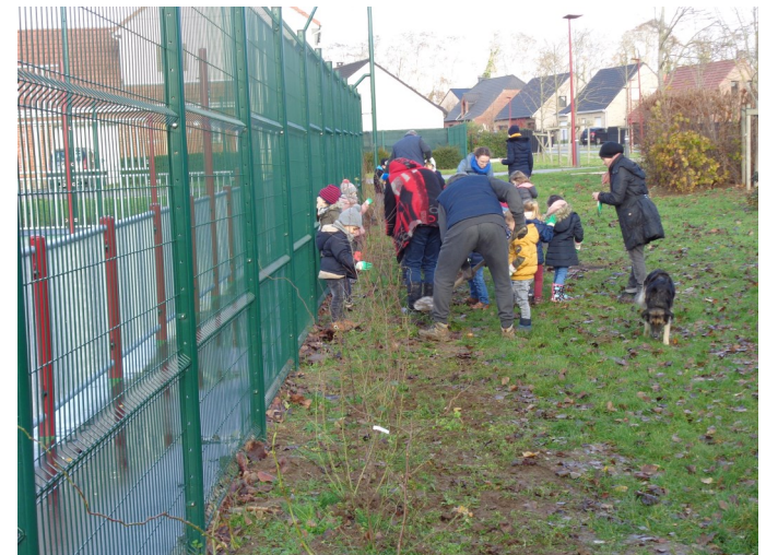
Plantation au Square Beltrame avec les enfants