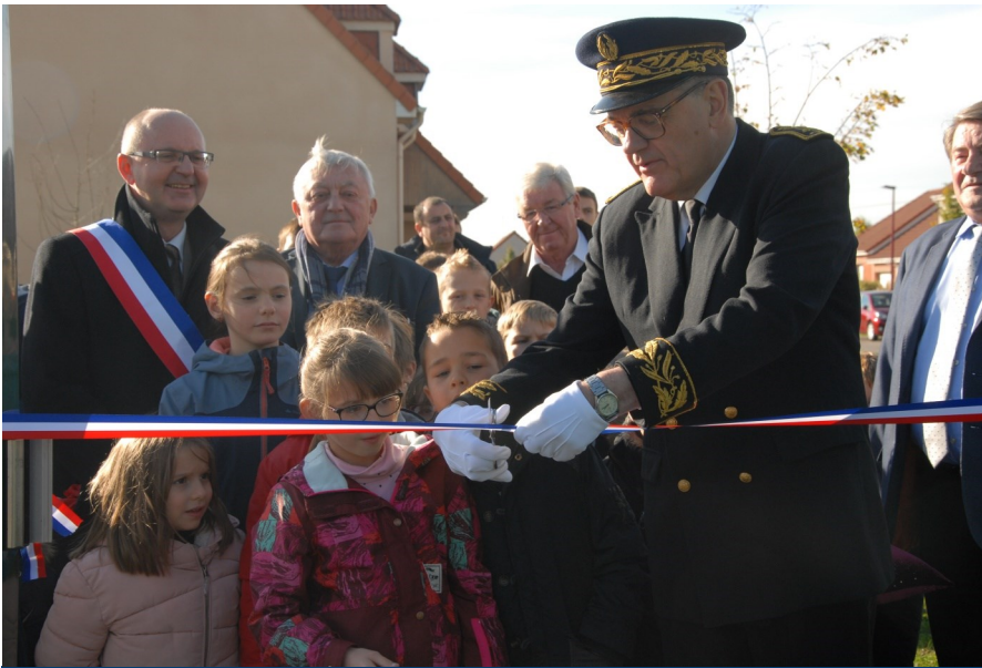
Monsieur le Sous-Préfet en compagnie des enfants coupe le ruban tricolore