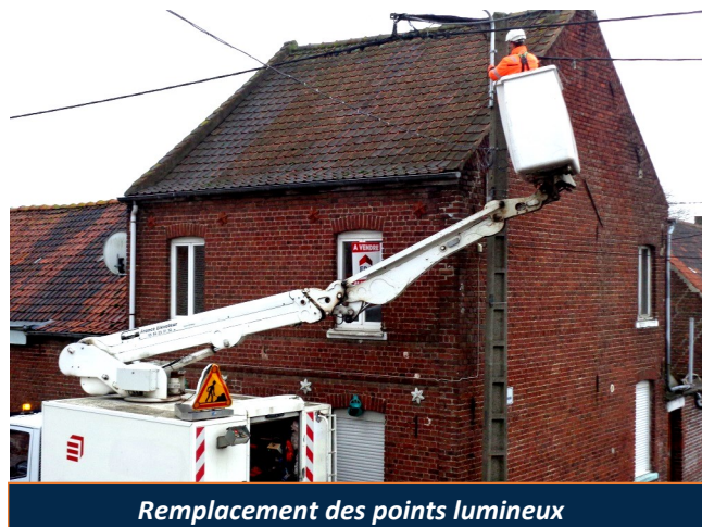
Remplacement des points lumineux