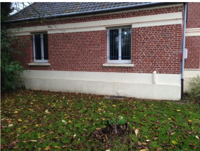
Remplacement des huisseries à la Sacristie de l'Eglise