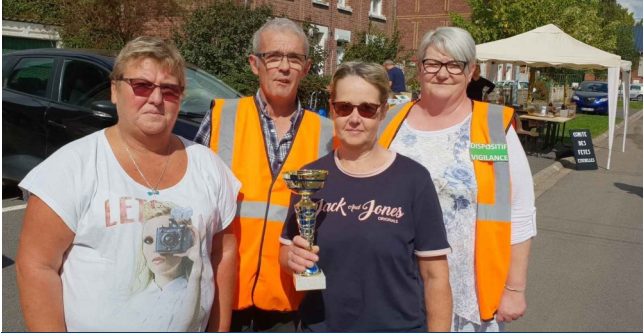
Remise de coupe lors de la Brocante de Septembre 2018