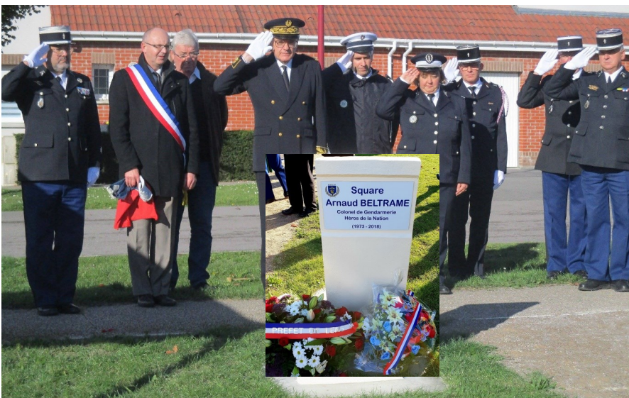
Hommage de Mr le Sous-Préfet et du Groupement de Gendarmerie de Béthune

Mr le Maire, a indiqué que c'est l'unanimité du Conseil Municipal qui a approuvé par délibération de dénommer ce lieu « Square du Colonel Arnaud Beltrame ». Cela afin de rendre hommage à cet héros de la nation. Il a rappelé que cet équipement avait été financé par des subventions obtenues auprès de la CALL et du Département.