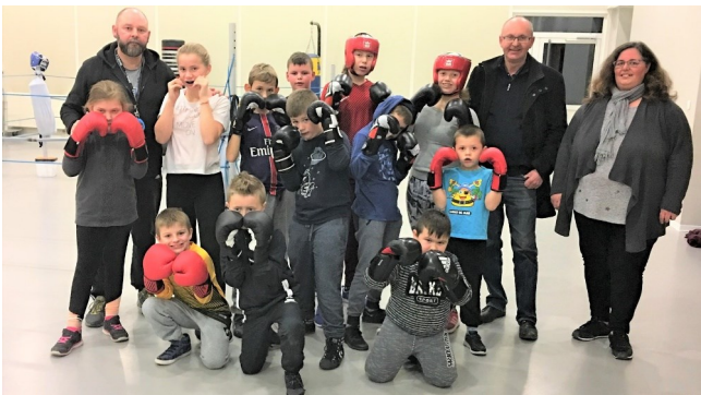
Avec les dirigeants du Boxing Club Estevellois

L' « Boxing Club Estevellois » vous invite à rejoindre les membres, afin de pratiquer une passion qui est la boxe, et invite petits et grands à découvrir les séances d'entraînements et d'initiations qui se déroulent le mardi et le vendredi de 18h à 19h pour les 6 -13ans et de 19h à 21h pour les 14 ans et + tout cela dans la joie et la bonne humeur!