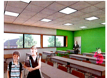
Vue d'une classe en 3D

Un design haut en couleur parfaitement adapté au public avisé : l'enfant.