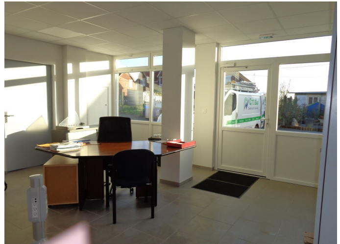
Après... nouveau bureau pour le service administratif