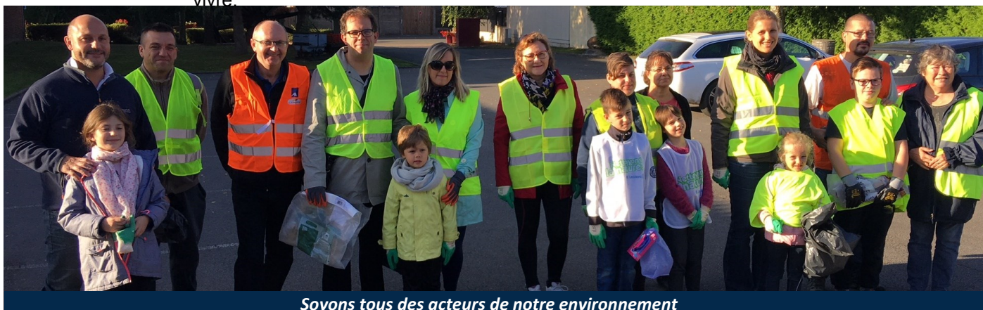
Soyons tous des acteurs de notre environnement

Des cendriers de rues seront mis en place prochainement dans la Commune mais il faut rappeler le caractère particulièrement polluant des mégots jetés sur la voie publique. Mr le Maire a remercié toute l'équipe et en particulier les enfants qui, par cette implication citoyenne, ont fait en sorte que la Commune d'Estevelles soit encore plus propre et ainsi plus agréable à vivre.