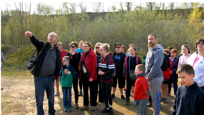
Avec les habitants, sur le territoire

Les élus de terrain que nous sommes ont pu ressentir également ce sentiment face aux mesures prises, afin de réduire les moyens des collectivités l'année dernière, mesures que nous subissons aujourd'hui de plein fouet et nombre de Maires ont fait le choix en 2018 de démissionner du fait du manque de moyens actuels pour fonctionner.