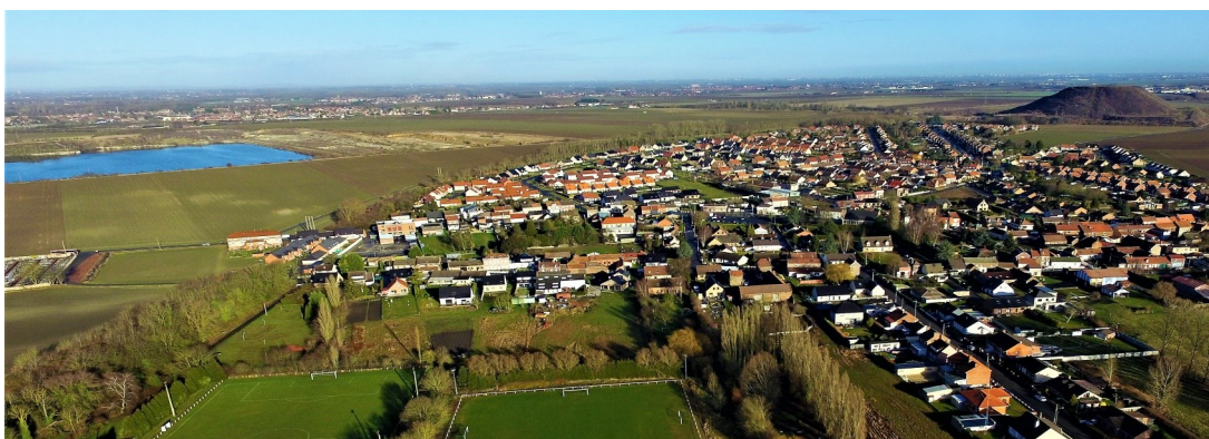
Estevelles, dans la Chaîne des Parcs, une réalité pour demain,