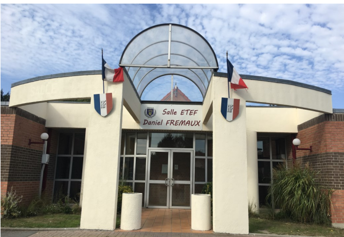
Rénovation de la façade de la Salle Etef D.Frémaux