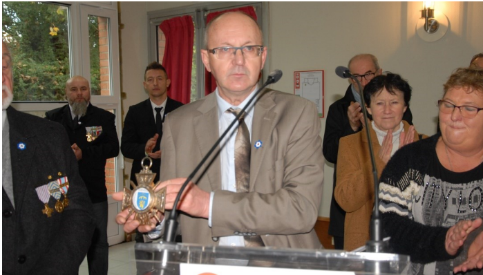
Monsieur le Maire présentant la Croix de Guerre, vive émotion.

La Commémoration du Centenaire de la Première Guerre Mondiale a débuté à Estevelles le 10 novembre 2018 par une randonnée guidée par le « Club du Neuf à Etef » expliquant la situation de notre village pendant la Guerre et décrivant des lieux stratégiques. Cette visite s'est poursuivie par un hommage au Monument aux Morts, où les enfants du Service Jeunesse ont lu la biographie de chaque personne tombée au combat, et avec les habitants ont allumé de petites bougies en hommage à nos disparus.