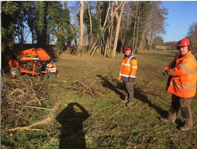
Entretien des espaces verts par l'ESAT