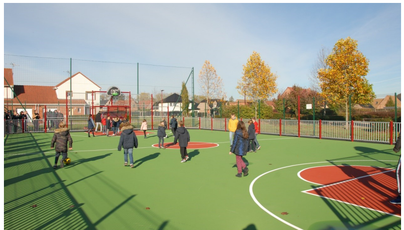
Le Plateau Multisport d'Estevelles

Un dépôt de gerbe a ensuite été effectué et une minute de silence observée. L'hymne National de la Marseillaise a été ensuite interprété par les enfants du service jeunesse.