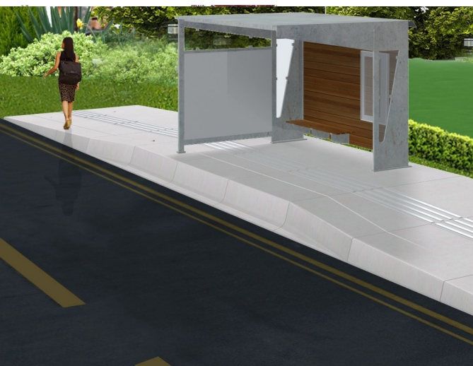
Futur aménagement des quais-bus en accessibilité "PMR"