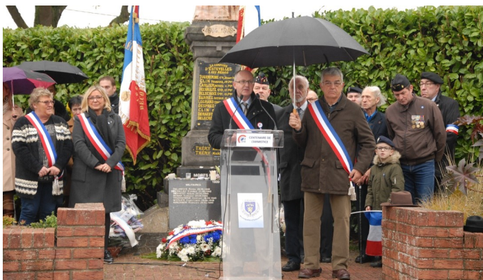
Prise de paroles au Monument aux Morts

Ce fleurissement s'est fait par les élèves de notre école. Nos petits écoliers étaient particulièrement intéressés par ce geste, ainsi que par la vie de ceux qui sont morts pour la France.