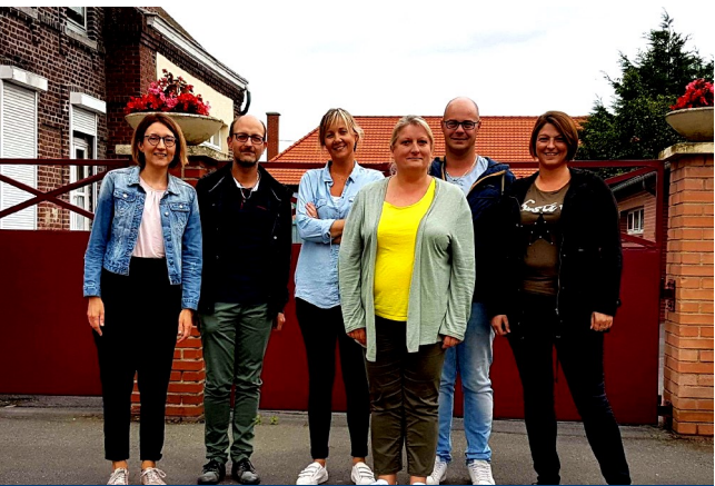
Le nouveau comité directeur de l'association

Mail : lesenfantsdaborddesteveselles@gmail.com ainsi que les boîtes aux lettres aux entrées des écoles.