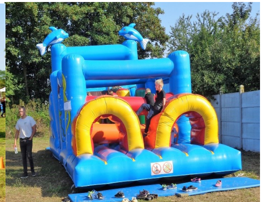
Un peu de détente avant la rentrée