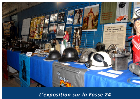
L'exposition sur la Fosse 24

Le panneau UNESCO situé à l'entrée de la ville nous rappelle aujourd'hui qu'Estevelles possède trois sites classés au Patrimoine Mondial de