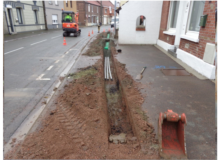
Travaux pour l'installation de la Fibre Optique