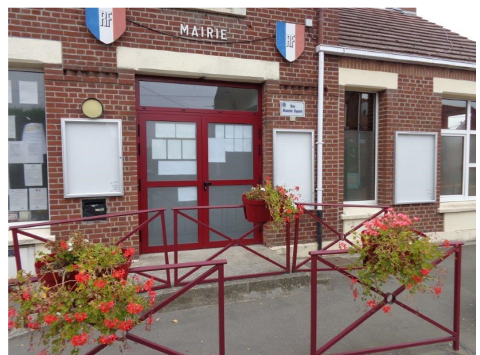
Installation de mobilier urbain à la Mairie