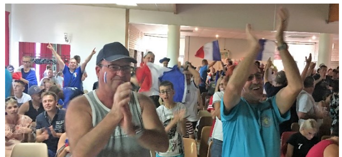
Avec les habitants, pour les grands moments

Plusieurs réunions de quartiers, rencontres citoyennes, manifestations publiques, rencontres avec les associations, se sont égrenées ces derniers mois, et c'est ce contact direct qui permet véritablement de donner de la lisibilité à notre action.